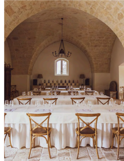
LA MASSERIA ALTAMURA NEL SUD ITALIA / THE " "