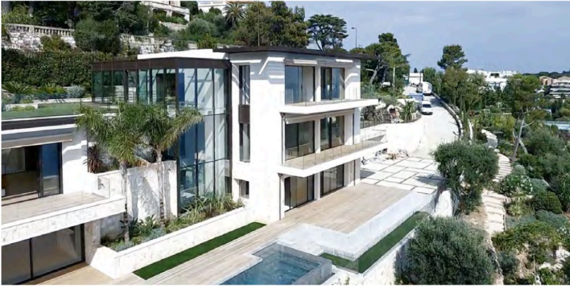
VILLA PRIVATA NEL SUD DELLA FRANCIA / A PRIVATE VILLAS IN SOUTH FRANCE