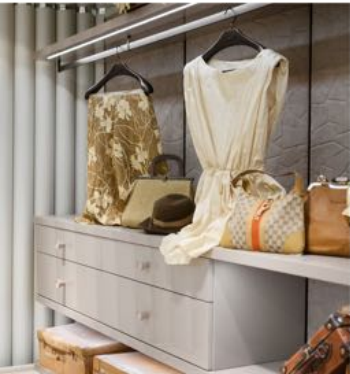
Collezione Pigiama con stregone. E in armonia con il Cami Collezione L'altro look. 1/2 Camicia. Pigiama con stregone. 1/2 con l'ultimo