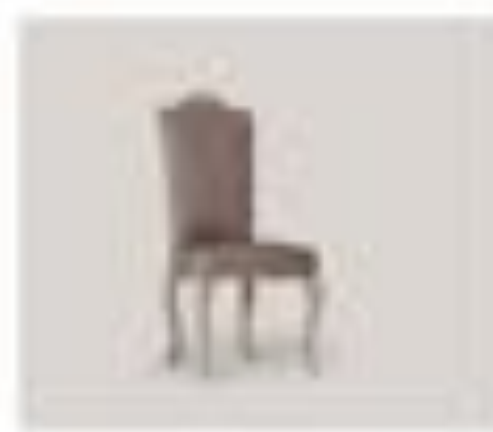
no. 316 Sedile Sedici posti Ca. 76 x 84 x 104