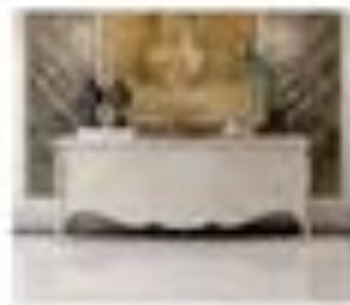
art. 3004 Console Pirella Göttsche Cx. 100 x 60 x 200 h.