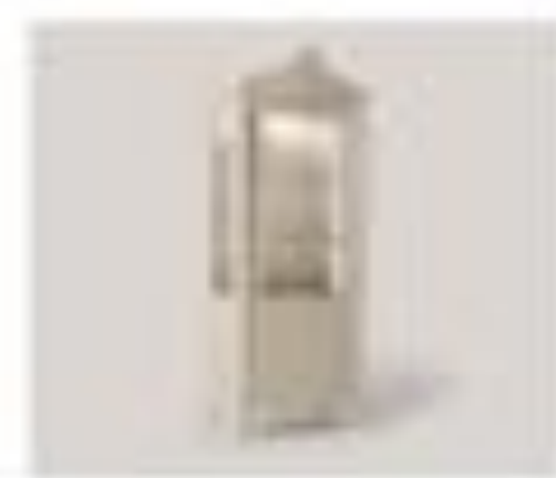
art. 3007 Parete tv Pirella Göttsche Cx. 90 x 200 x 200 h.