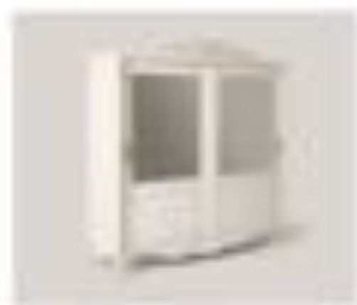
nr. 301 Incastrato Chiuso Bianco Cm. 140x110x20h