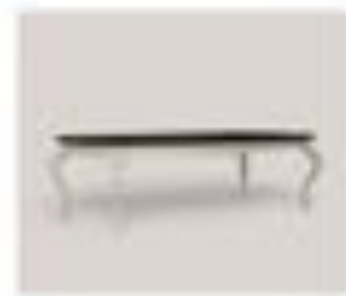
no. 307 Tavolo rettangolare Sedici posti Sedici posti Ca. 284 x 124 x 76 Ca. 284 x 124 x 76