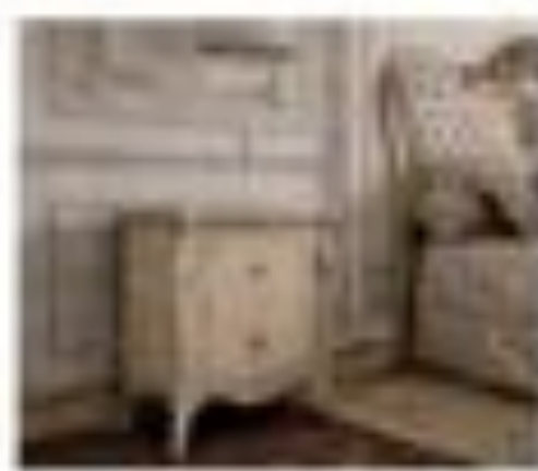
no. 318 Tavolo Sedici posti Ca. 224 x 128 x 76