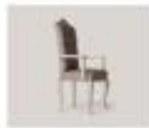
no. 315 Capitonné capitonné Sedici posti Ca. 76 x 84 x 104