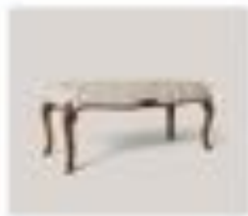
no. 310 Tavolo Sedici posti Ca. 128 x 128 x 76