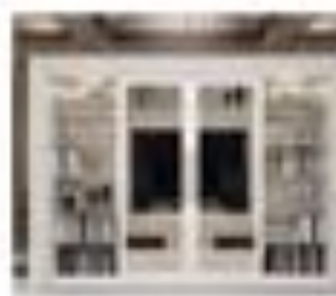
art. 3009 Parete tv Pirella Göttsche Cx. 240 x 90 x 200 h.