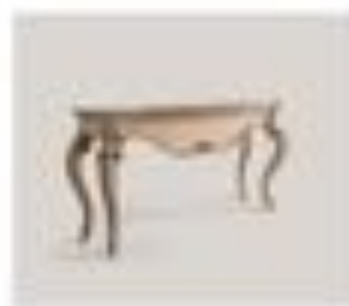
art. 3001M Console con metallo Details with metallo top Cx. 200 x 80 x 200 h.