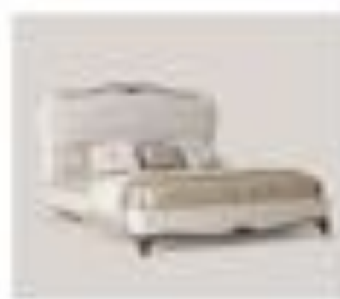
no. 313 Tavolo capitonné Sedici posti Ca. 224 x 128 x 76 Ca. 224 x 76