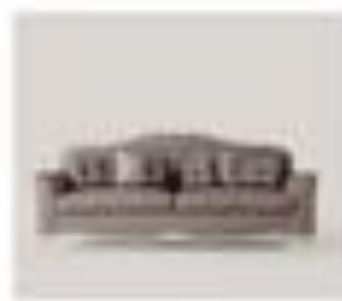
art. 3012 Divano Pirella Göttsche Cx. 220 x 80 x 200 h.