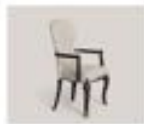
no. 311 Capitonné capitonné Sedici posti Ca. 76 x 84 x 104