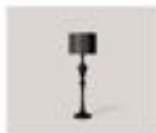
nr. 309 Tavolo Bianco Cm. 200x140x110h