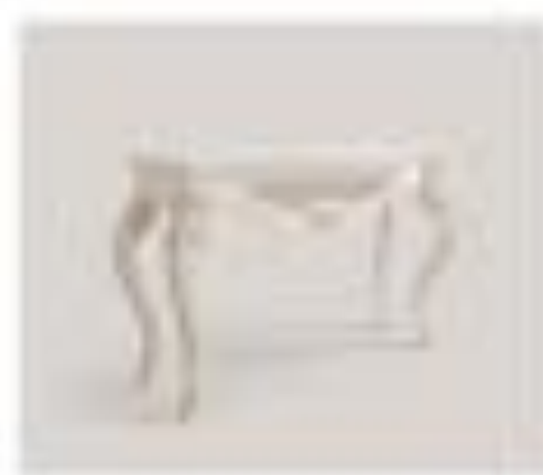
art. 3002 Console salotto Pirella Göttsche Cx. 130 x 80 x 200 h.