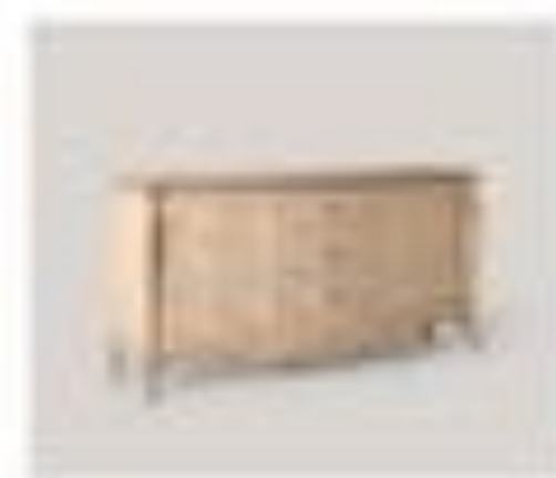
art. 3000 Console Salswood Cx. 220 x 90 x 200 h.