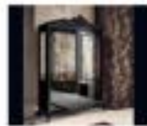
art. 3011 Parete tv Pirella Göttsche Cx. 170 x 200 x 200 h.