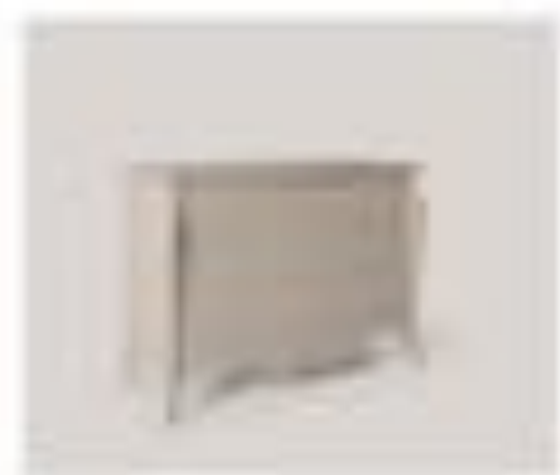
nr. 300 Quad Chiuso Cm. 140x110x20h