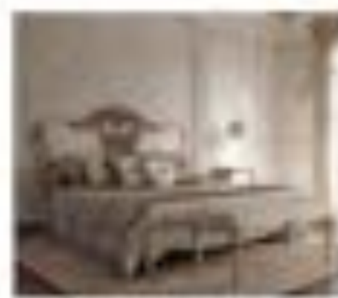
no. 317 Tavolo capitonné Sedici posti Ca. 224 x 128 x 76 Ca. 224 x 76