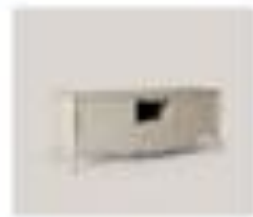
art. 3003 Console salotto Pirella Göttsche Cx. 200 x 60 x 200 h.