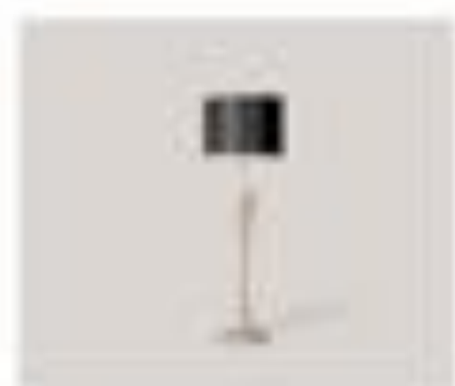
nr. 308 Tavolo Bianco Cm. 200x140x110h