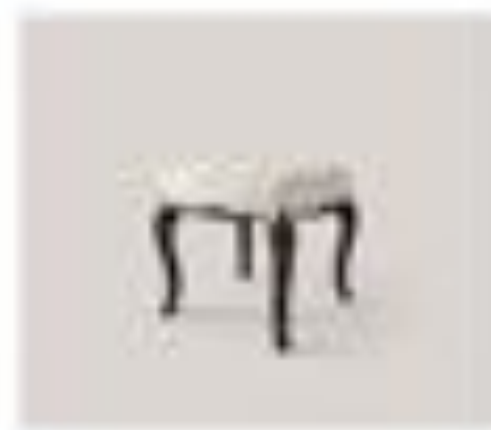
no. 309 Tavolo Sedici posti Ca. 128 x 128 x 76