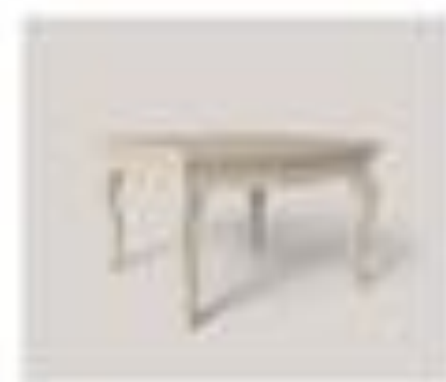
no. 302 Tavolo quadrato Sedici posti Ca. 77 x 77 x 76