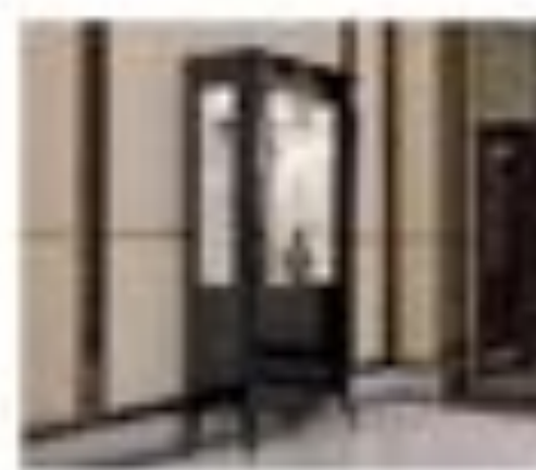
art. 3008M Parete tv Pirella Göttsche Cx. 90 x 200 x 200 h.