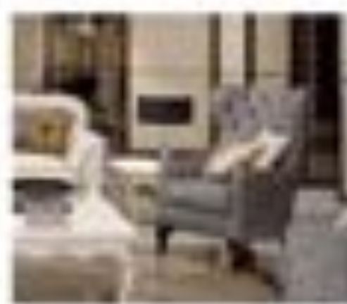
art. 3010 Parete immagine Corbelli Göttsche Cx. 240 x 90 x 200 h.