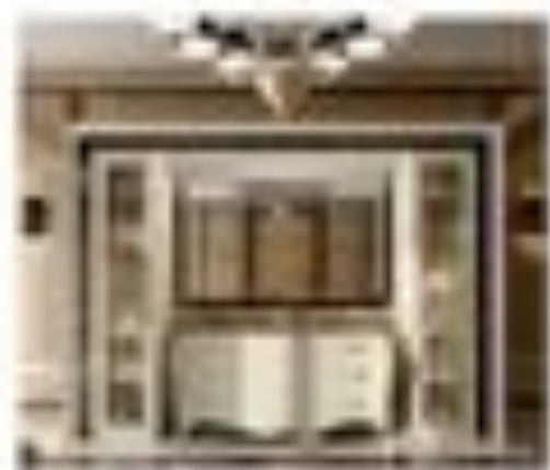
nr. 302 Mettibile da parete o appeso Chiuso con for. soffitti Cm. 140x110x20h