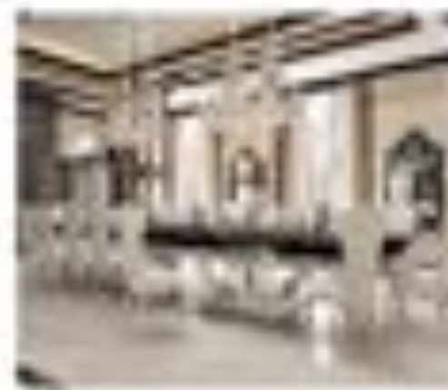
no. 308 Tavolo rettangolare Sedici posti Ca. 284 x 124 x 76 Ca. 284 x 124 x 76