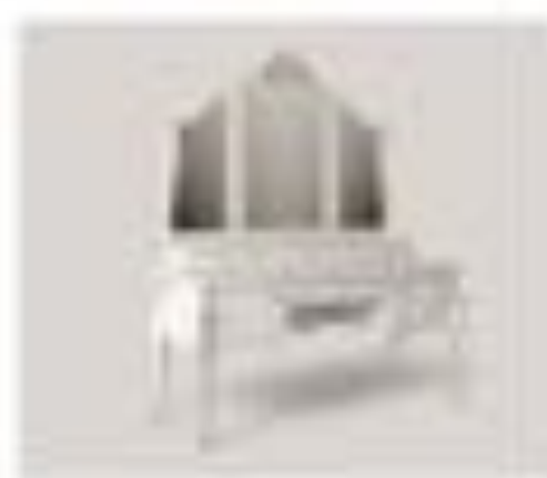
no. 305 Sedile ovale Sedici posti Ca. 128 x 128 x 76 no. 306 Sedile ovale Sedici posti Ca. 128 x 128 x 76