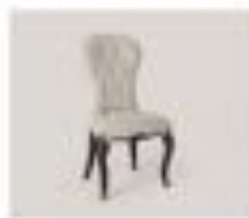
no. 312 Sedile capitonné Sedici posti Ca. 76 x 84 x 104