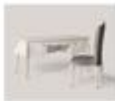
no. 304 Sedile Sedici posti Ca. 128 x 128 x 76