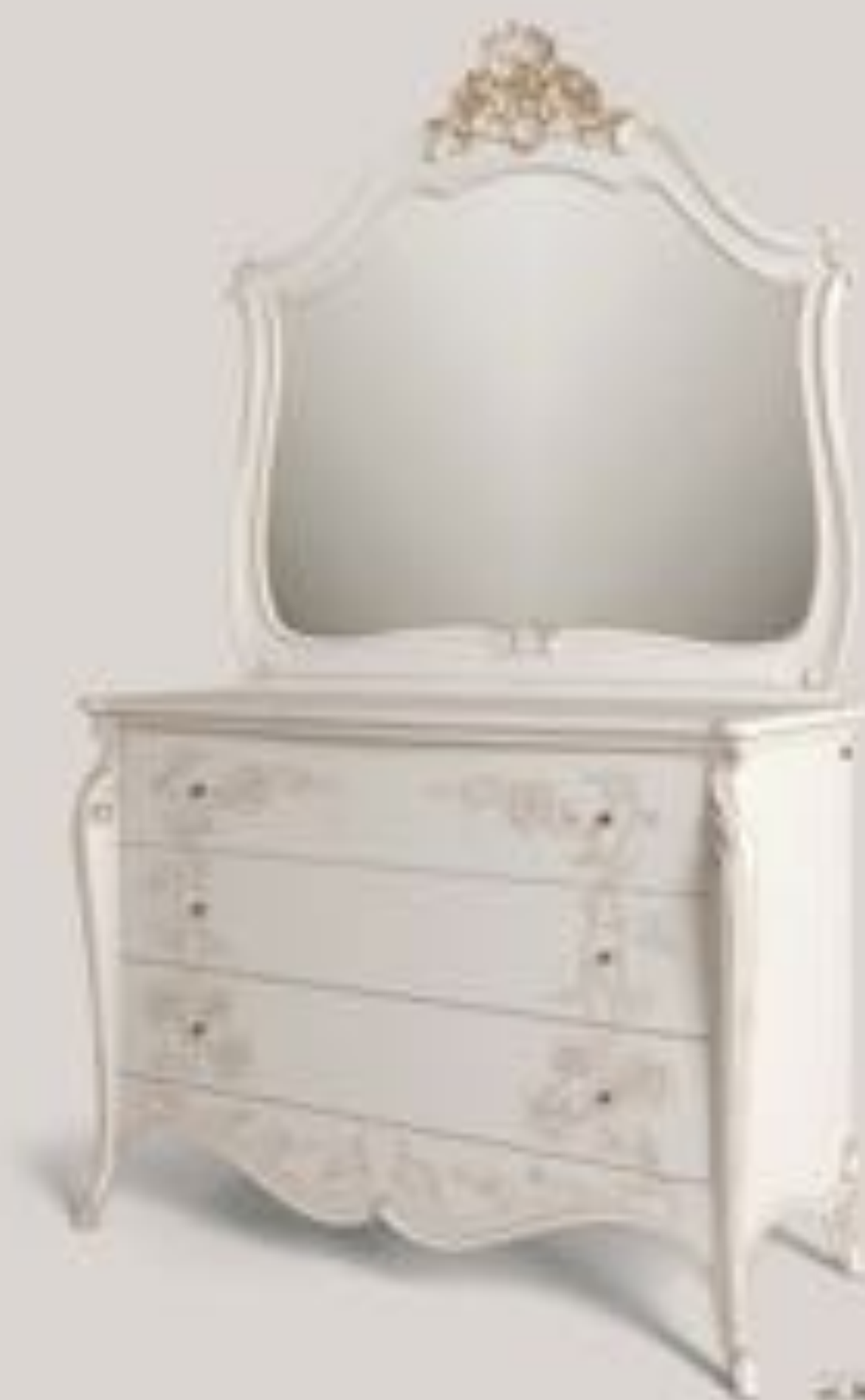
MASTER BEDROOM Dresser Mirror