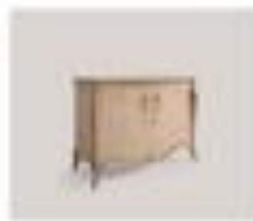
art. 3001 Console Salswood Cx. 170 x 90 x 200 h.