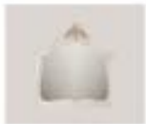
nr. 305 Appeso Bianco Cm. 140x110x20h