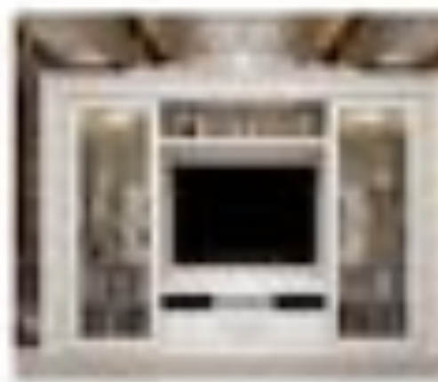
art. 3006 Parete immagine Corbelli Göttsche Cx. 240 x 90 x 200 h.