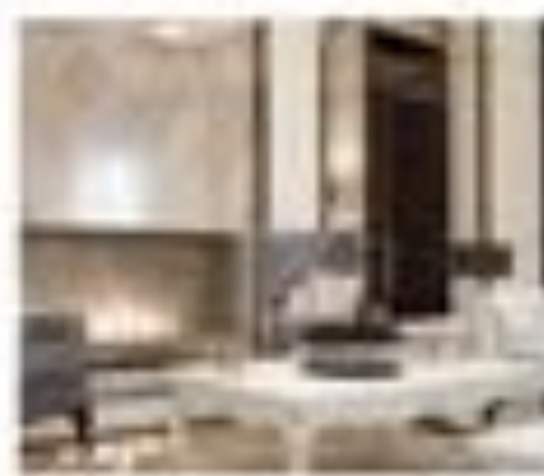
art. 3013 Parete immagine Corbelli Göttsche Cx. 170 x 200 x 200 h.