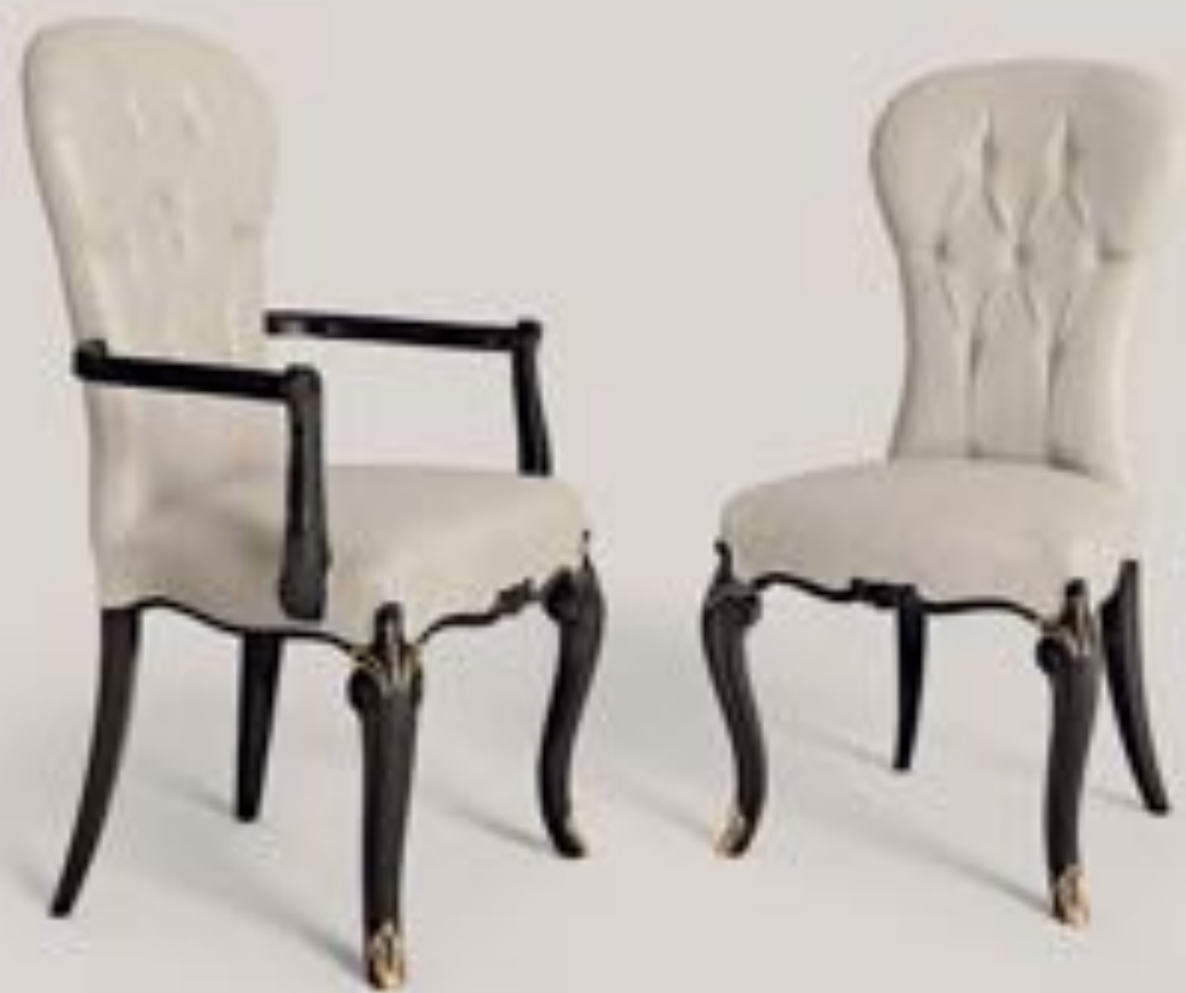
AL. 100100001 Espresso/Walnut Armchair in fabric 100% AL. 100100002 Espresso/Walnut Chair in fabric 100% AL. 100100003 Espresso/Walnut Chair in fabric 100%