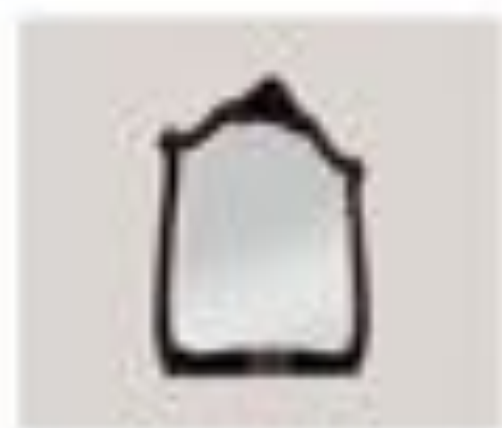
nr. 306 Appeso Bianco Cm. 140x110x20h