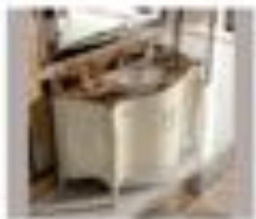
nr. 304 Mettibile da parete o appeso Chiuso con for. soffitti Cm. 140x110x20h