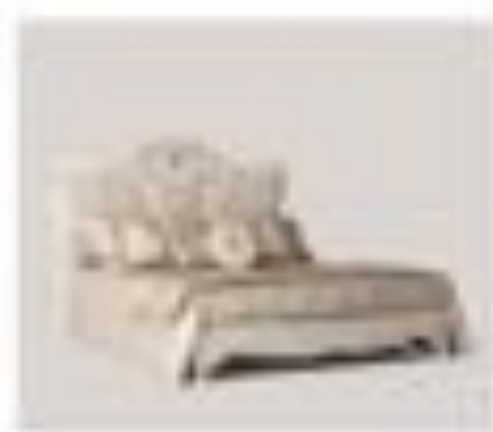
no. 314 Tavolo Sedici posti Ca. 224 x 128 x 76 Ca. 224 x 76