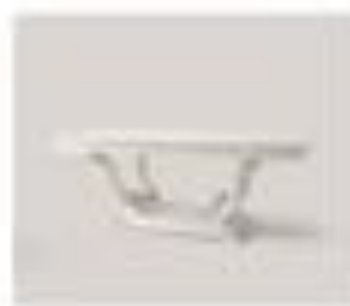
no. 303 Tavolo ovale Sedici posti Ca. 224 x 128 x 76 Ca. 224 x 128 x 76