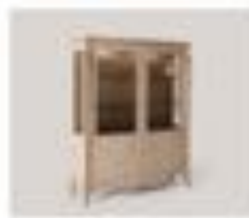
art. 3009M Parete tv Pirella Göttsche Cx. 170 x 200 x 200 h.