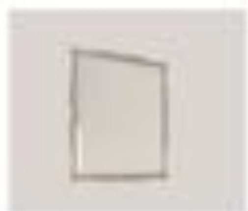
nr. 307 Appeso Bianco Cm. 140x110x20h