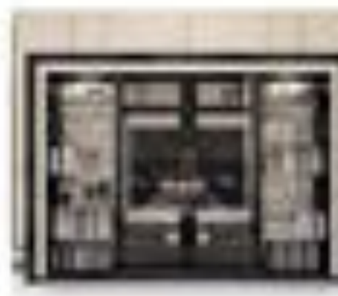
art. 3005 Parete tv Pirella Göttsche Cx. 240 x 90 x 200 h.