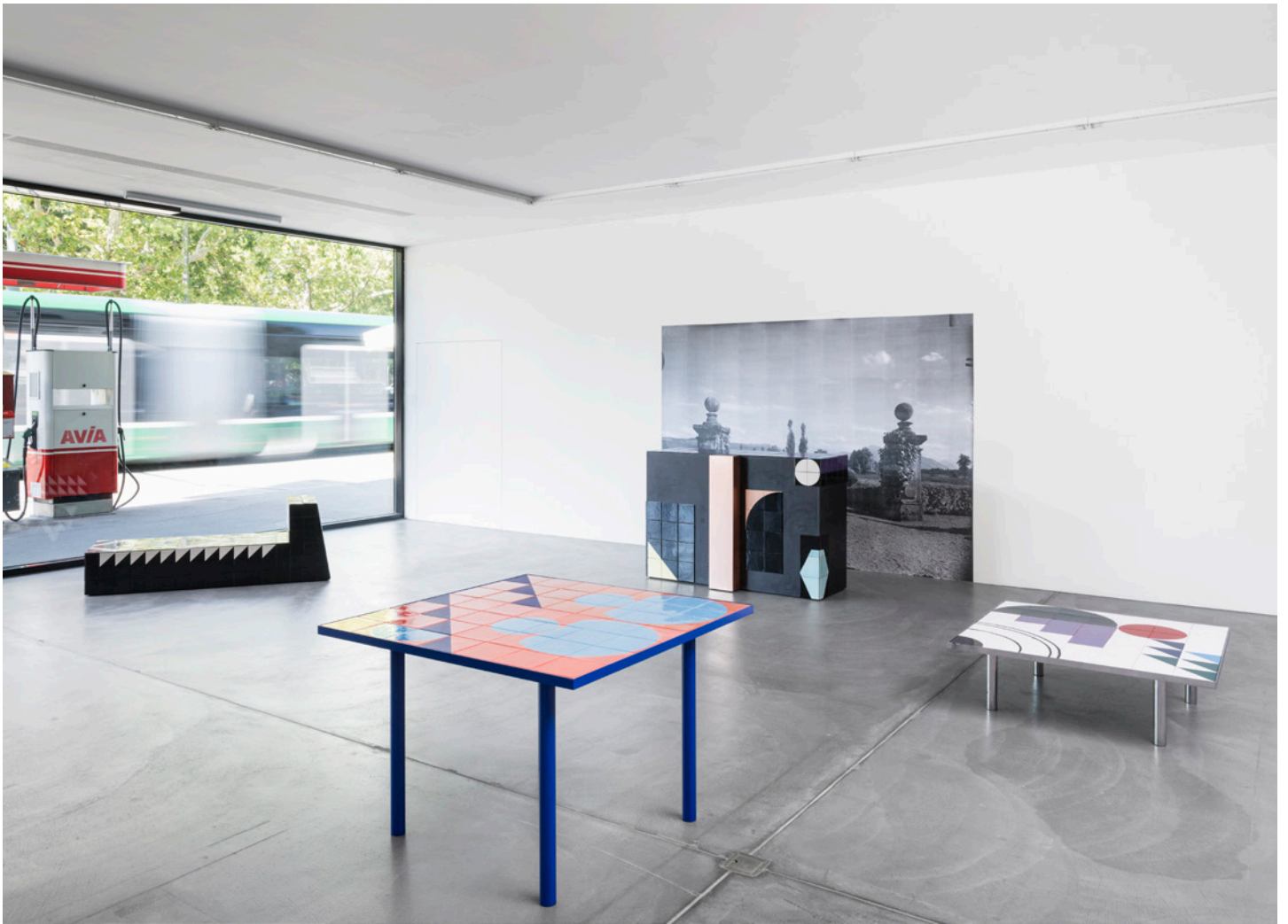
ES25 EDITIN CLAUDIA WIESER "RED AND BLUE" TISCH / TABLE ARTWORK: CLAUDIA WIESER, 2024 DESIGN: PHILIPP MAINZER, FARAH EBRAHIMI, 2023 GLASIERTE KERAMIKFLIESEN AUF MDF / GLAZED CERAMIC TILES ON MDF STAHL, PULVERBESCHICHTET / STEEL, POWDERCOATED