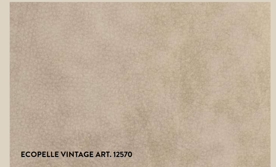
ECOPELLE VINTAGE ART. 12570