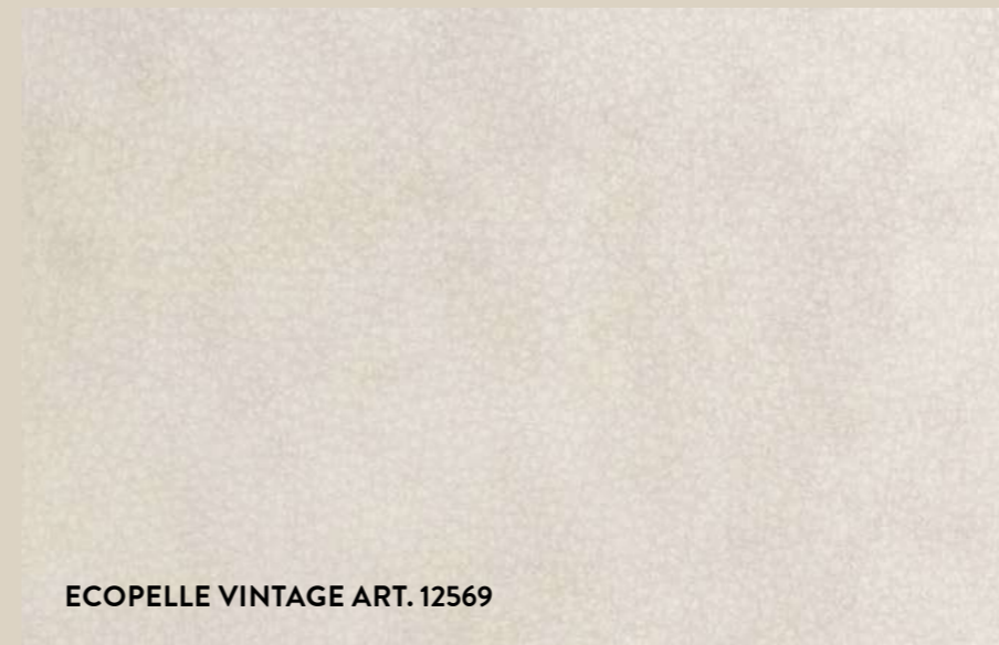
ECOPELLE VINTAGE ART. 12569