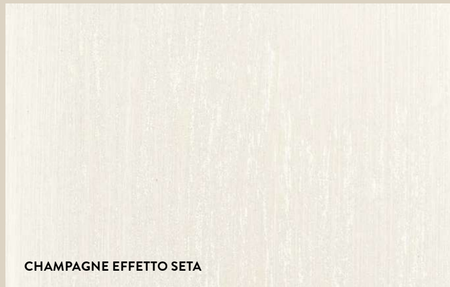
CHAMPAGNE EFFETO SETA