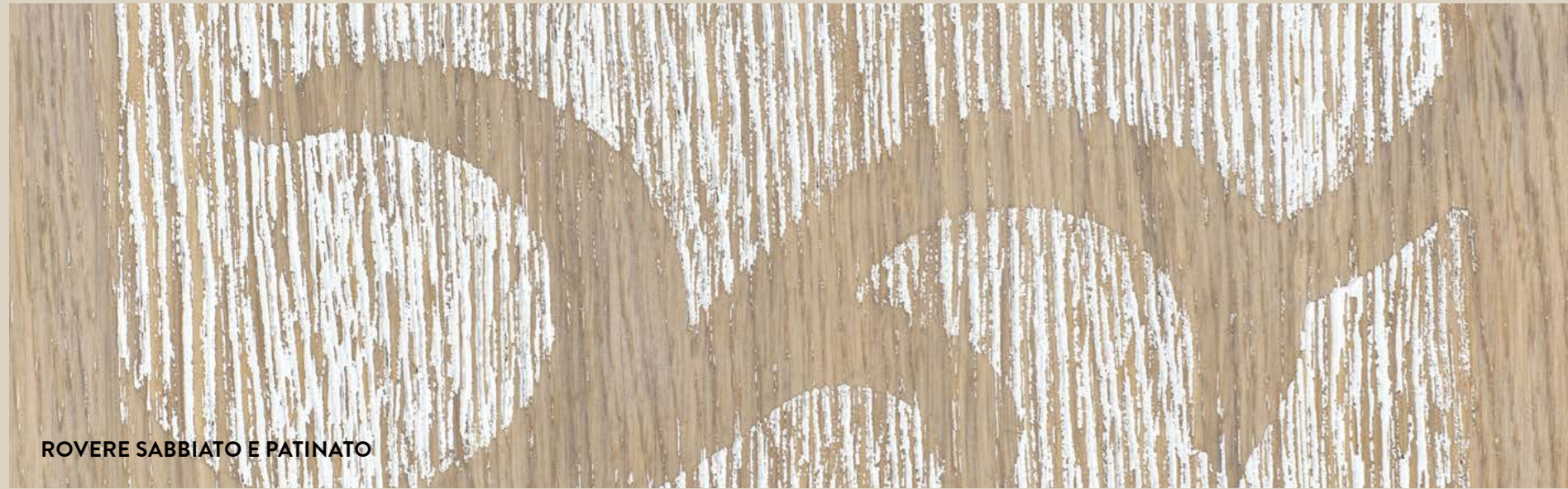
ROVERE SABBBIATO E PATINATO