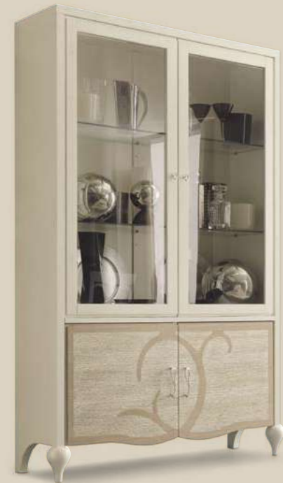
Art. NA004 Vetrina Glass cupboard L.134 H.210 P.43