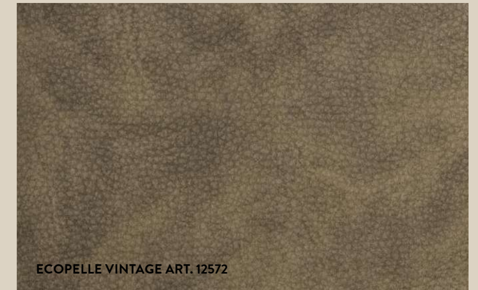
ECOPELLE VINTAGE ART. 12572

TUTTE LE FINITURE POSSONO ESSERE PULITE CON UN PANNINO DI COTONE UMIDO ALL THE FINISHES CAN BE CLEANED WITH A DAMP COTTON RAG.