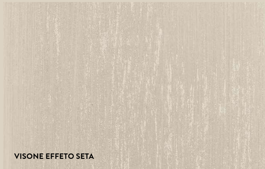
VISONE EFFETO SETA