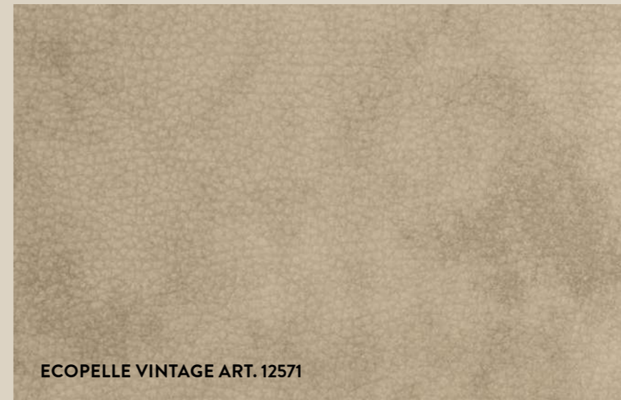
ECOPELLE VINTAGE ART. 12571