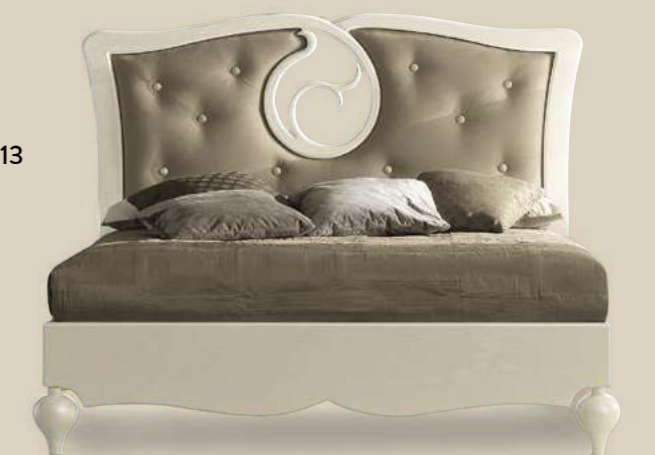
Art. NA015 Letto Bed L.181 H.135 P.213