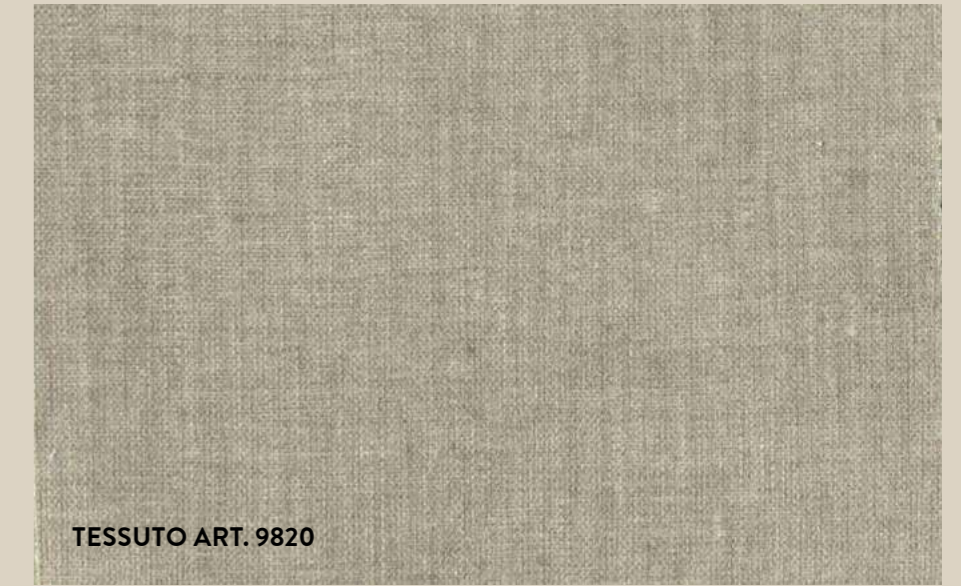
TESSUTO ART. 9820