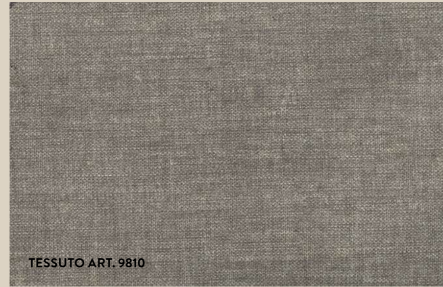
TESSUTO ART. 9810