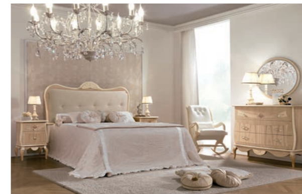
BOREALE Pagg. 74-75

Art. 301 BON Armadio 3/A Scorrevoli 3/D. Sliding Wardrobe cm. 296 x 75 x 249 h. Mc. 2,19