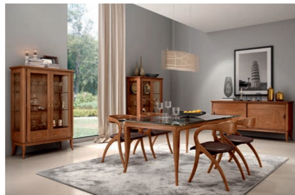
EPOCA Pagg. 52-53

Art. 850 ECN Composizione TV (con cuoio) TV Composition (with leather) cm. 290 x 44 x 230 h. Mc. 2,10