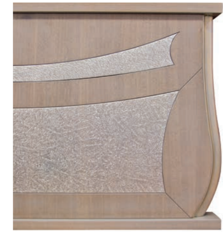
GRIGIO PASTELLO (BOG)