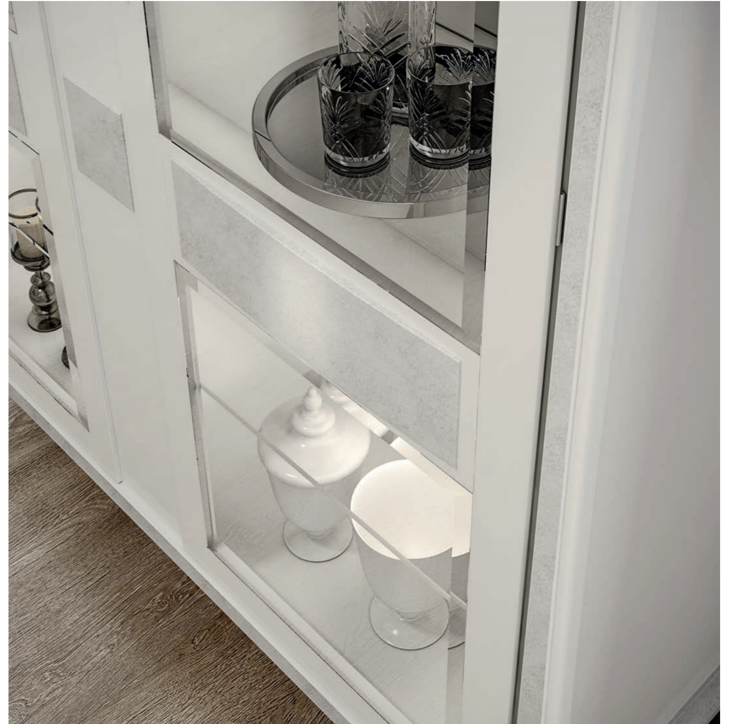
Dettagli di incomparabile bellezza Details of incomparable beauty