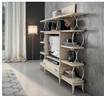
EPOCA Pagg. 40-41

Art. 804 EPO Specchiera Mirror cm.70 x 90 h. Mc. 0,06