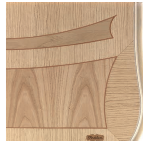
NATURALE A CERA (BON)