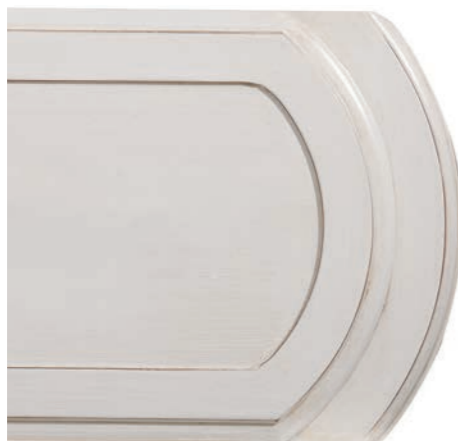
BIANCO PROVENZALE (EBP)