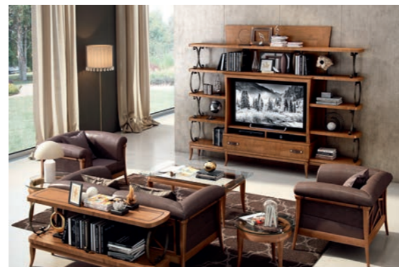
EPOCA Pagg. 44-45

Art. 805 EBP Composizione Tv Tv Composition cm. 290 x 44 x 230 h. Mc. 2,10