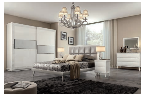
NOVECENTO Pagg. 14-15

Art. 844 CCN Sedia n.1 (Imb. Pelle) Chair n.1 (Leather) cm. 48 x 48 x 106 h. - seduta cm. 50 h. Mc. 0,20