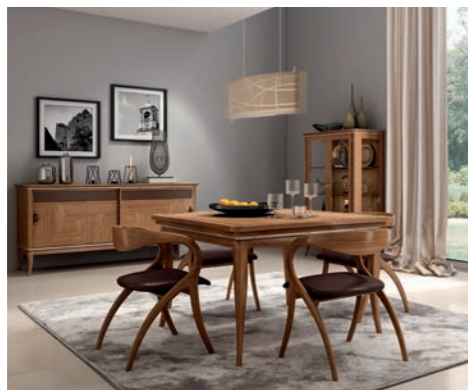
EPOCA Pagg. 58-59

Art. 828 ECN Cristalliera 2 Ante (con cuoio) 2 Doors Glass Cabinet (with leather) cm. 110 x 44 x 160 h. Mc. 0,95