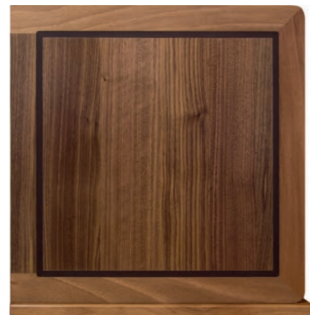
CANALETTO NATURALE (ECN)