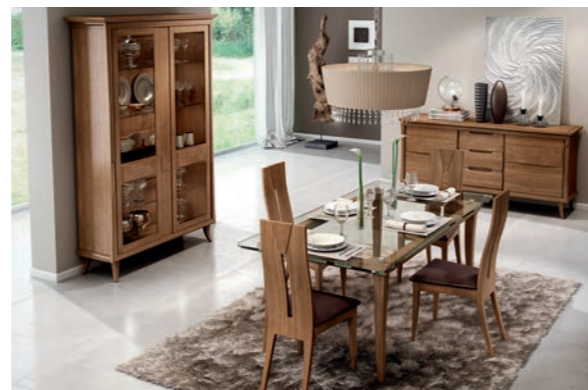
CLOÉ Pagg. 10-11

Art. 835 CCN Specchiera per Comò Mirror for Dresser cm. 90 x 70 h. Mc. 0,06