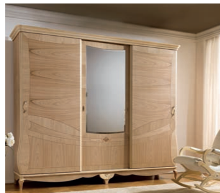
BOREALE Pag. 73

Art. 311 BOP Testata Letto King c/giroletto interno (Imb. Alcantara - Stoffa - Ecopelle - Legno) King Headboard Bed w/interior bedframe (Alcantara - Fabric - Eco Leather - Wood) cm. 233 x 149 h. - Mc. 0,54 (per rete/for spring 200 x 200)