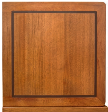
CANALETTO NOCE (EPO)