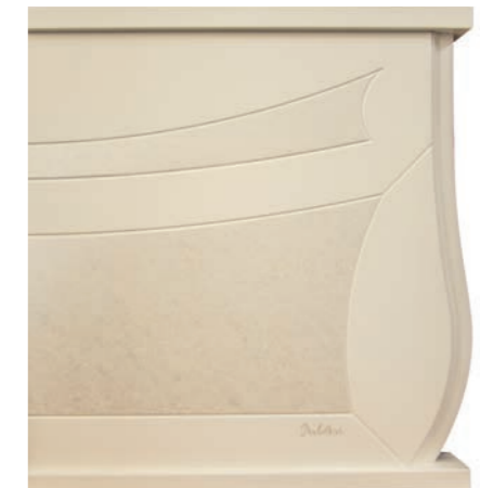
AVORIO PERLA (BOP)