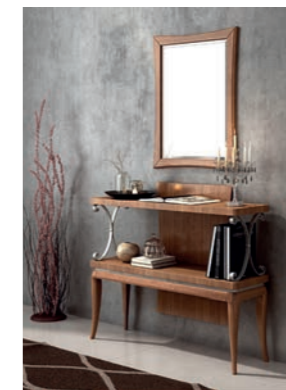
EPOCA Pag. 67

Art. 848 ECN Pannello Panel cm. 183 x 230 h. Mc. 0,44