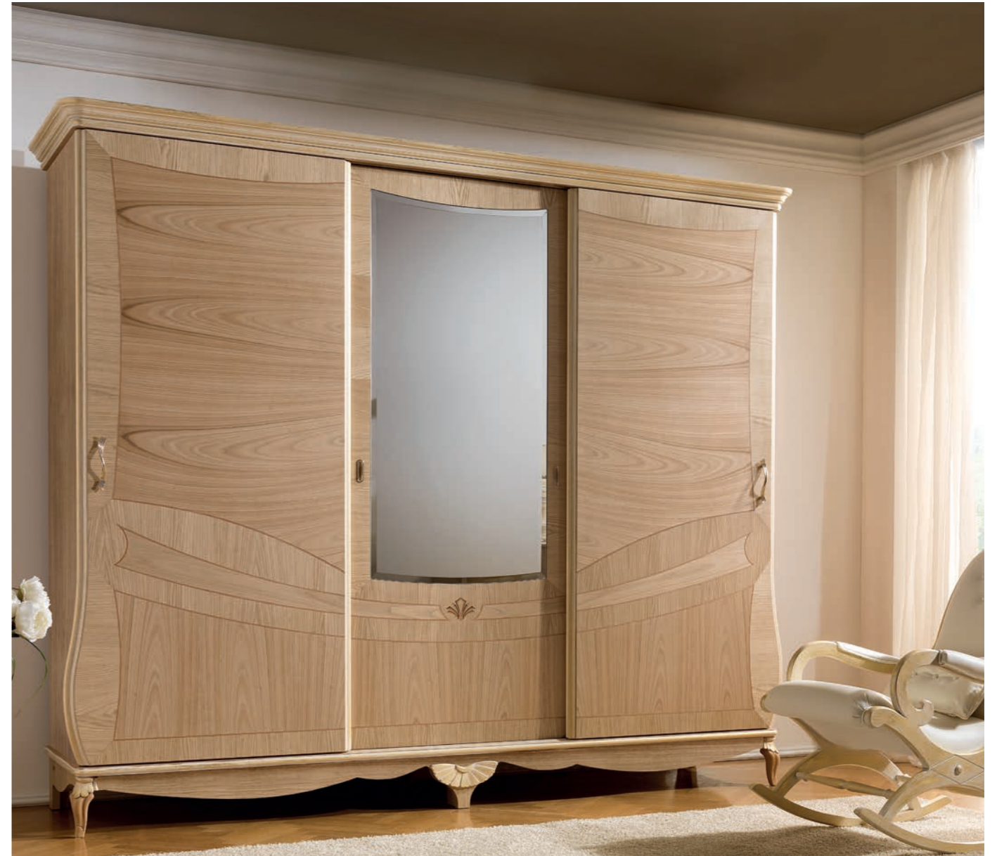
Giochi di chiari scuri, di intarsi e di preziose essenze Games of clear dark colours, of inlays and of precious essences