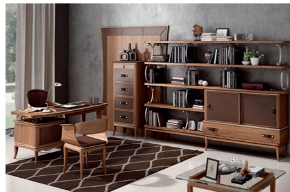
EPOCA Pagg. 62-63

Art. 827 ECN Tavolo Quadrato All.le Ext. Square Table cm. 120 x 120 (+ 40 + 40) x 79 h. Mc. 0,80