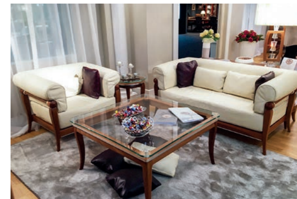
EPOCA Pagg. 46-47

Art. 825 EPO Poltrona salotto (pelle) Armchair for sofa set (leather) cm. 100 x 80 x 77 h. Mc. 0,82