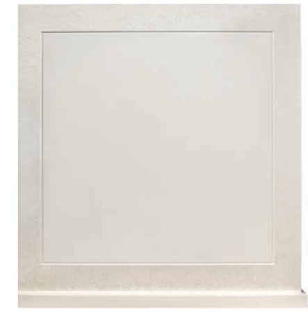
BIANCO PERLATO (NVB)