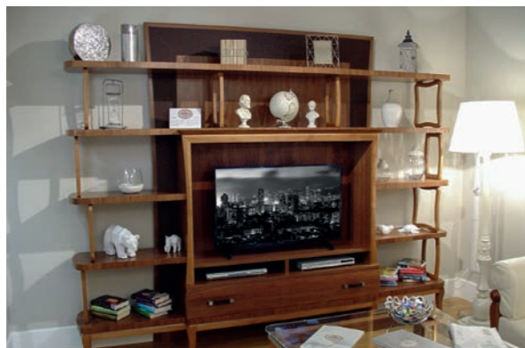
EPOCA Pagg. 48-49

Art. 850 ECN Composizione TV (con cuoio) TV Composition (with leather) cm. 290 x 44 x 230 h. Mc. 2,10