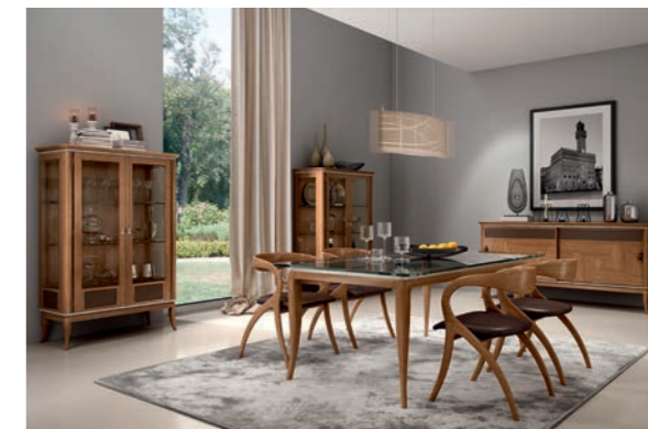
EPOCA Pagg. 56-57

Art. 850 ECN Composizione Tv (con cuoio) Tv Composition (with leather) cm. 290 x 44 x 230 h. Mc. 2,10