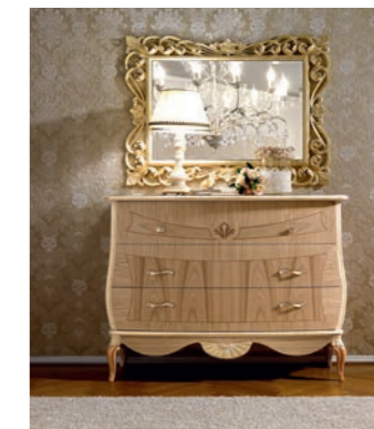
BOREALE Pag. 76

Art. 307 BOA Poltrona a dondolo Rocking Armchair cm. 64 x 97 x 100 h. Mc. 0,73