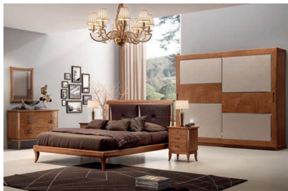
EPOCA Pagg. 38-39

Art. 800 EPO Armadio 2/A Scorrevoli 2/D. Sliding Wardrobe cm. 290 x 68 x 245 h. Mc. 2,69