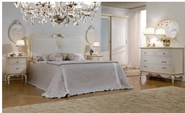
BOREALE Pagg. 70-71

Art. 301 BOP Armadio 3/A Scorrevoli 3/D. Sliding Wardrobe cm. 296 x 75 x 249 h. Mc. 2,19