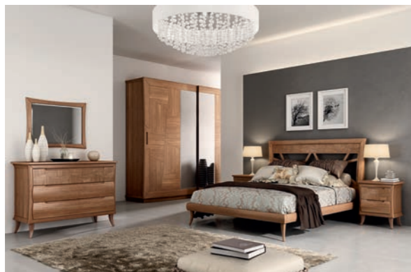
CLOÉ Pagg. 6-7

Art. 830 CCN Armadio 2/A Scorrevoli 2/D. Sliding Wardrobe cm. 290 x 68 x 245 h. Mc. 2,69