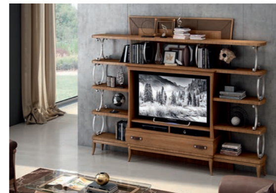
EPOCA Pagg. 54-55

Art. 810 EPO Sedia n.1 (Legno) Chair n.1 (Wooden) cm. 49 x 45 x 107 h. - seduta cm. 50 h. Mc. 0,25