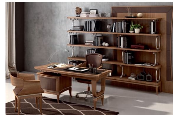
EPOCA Pagg. 64-65

Art. 820 ECN Poltroncina Ospite per studio Guest Armchair for studio cm. 63 x 56 x 79 h. Mc. 0,34