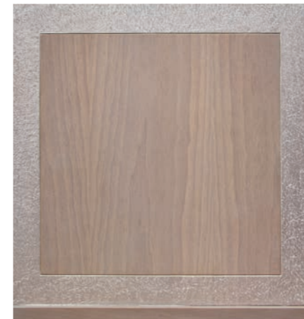
GRIGIO PASTELLO (NVG)