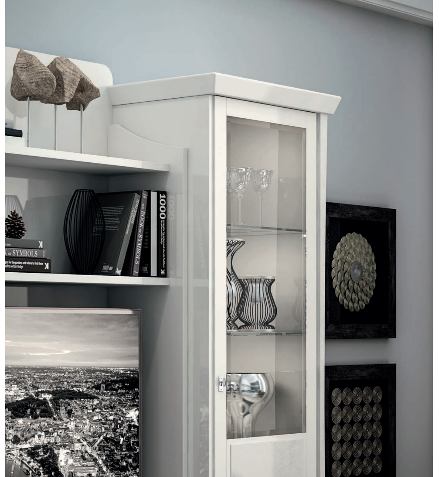
Novecento trasmette emozioni di delicate atmosfere Novecento transmits emotions of delicate atmospheres