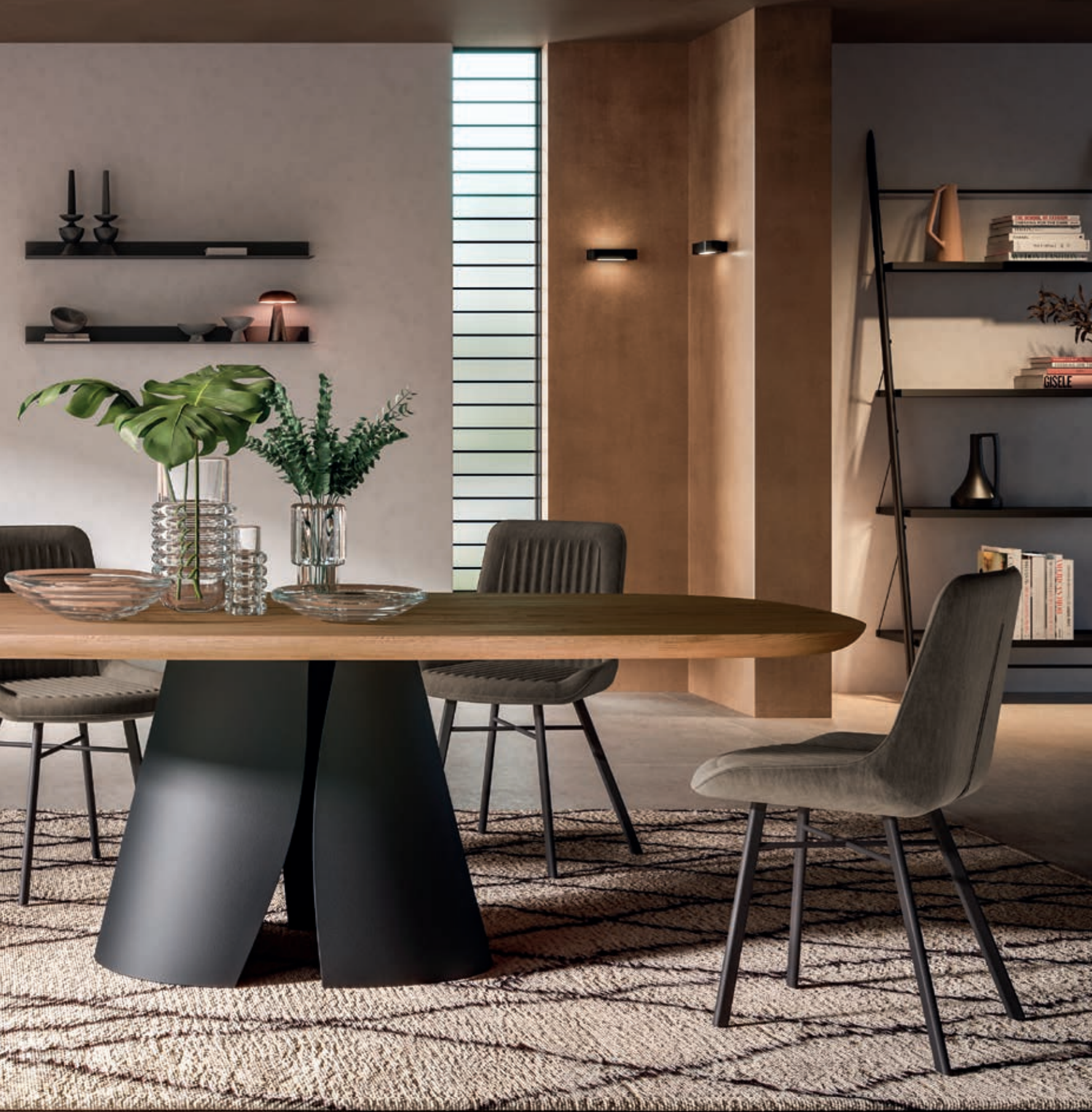
Piano/top. / Cosmopolitan - Basamento/base. / Shell - Sedia/Chair. / Sixty Madia/sideboard. / Arbor - Libreria/bookshelf. / Easy - Mensole/Shelve