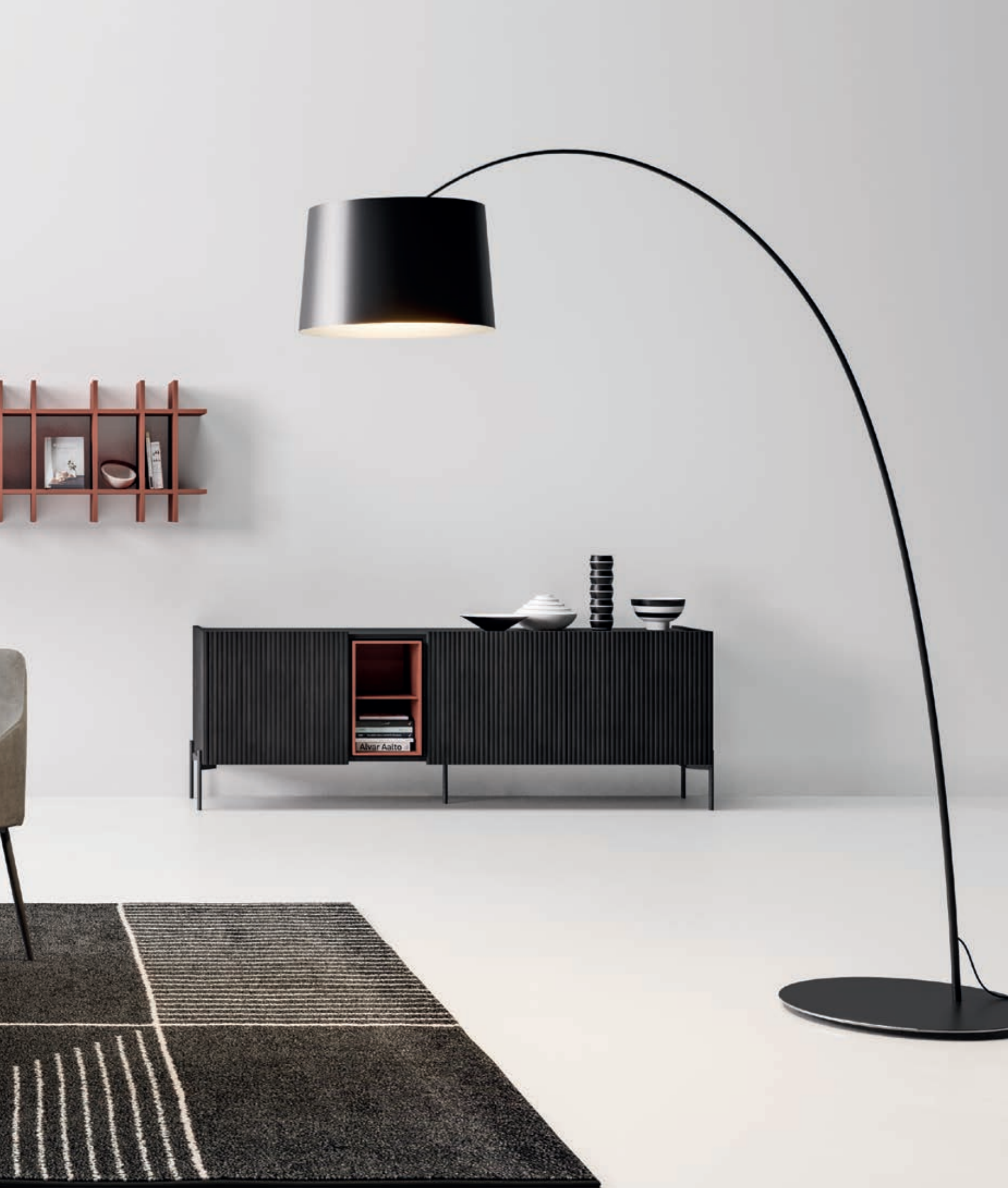
Piano/top. / Manhattan slice - Basamento/base. / Pillar 3 - Sedia/chair. / James Madia/sideboard. / Zero. 22 - Libreria/bookshelf. / Ritmo