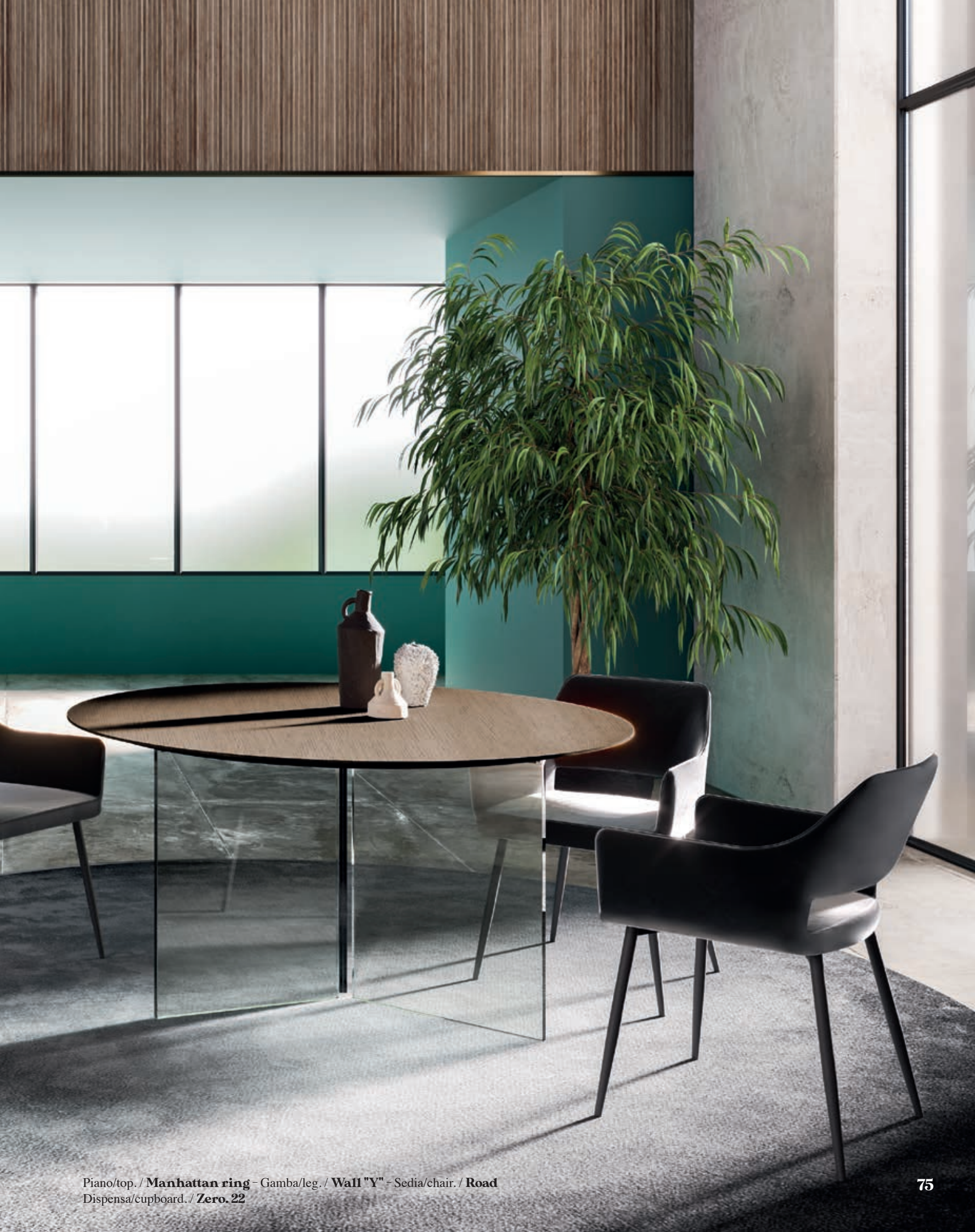
Piano/top. / Manhattan ring - Gamba/leg. / Wall "Y" - Sedia/chair. / Road Dispensa/cupboard. / Zero. 22