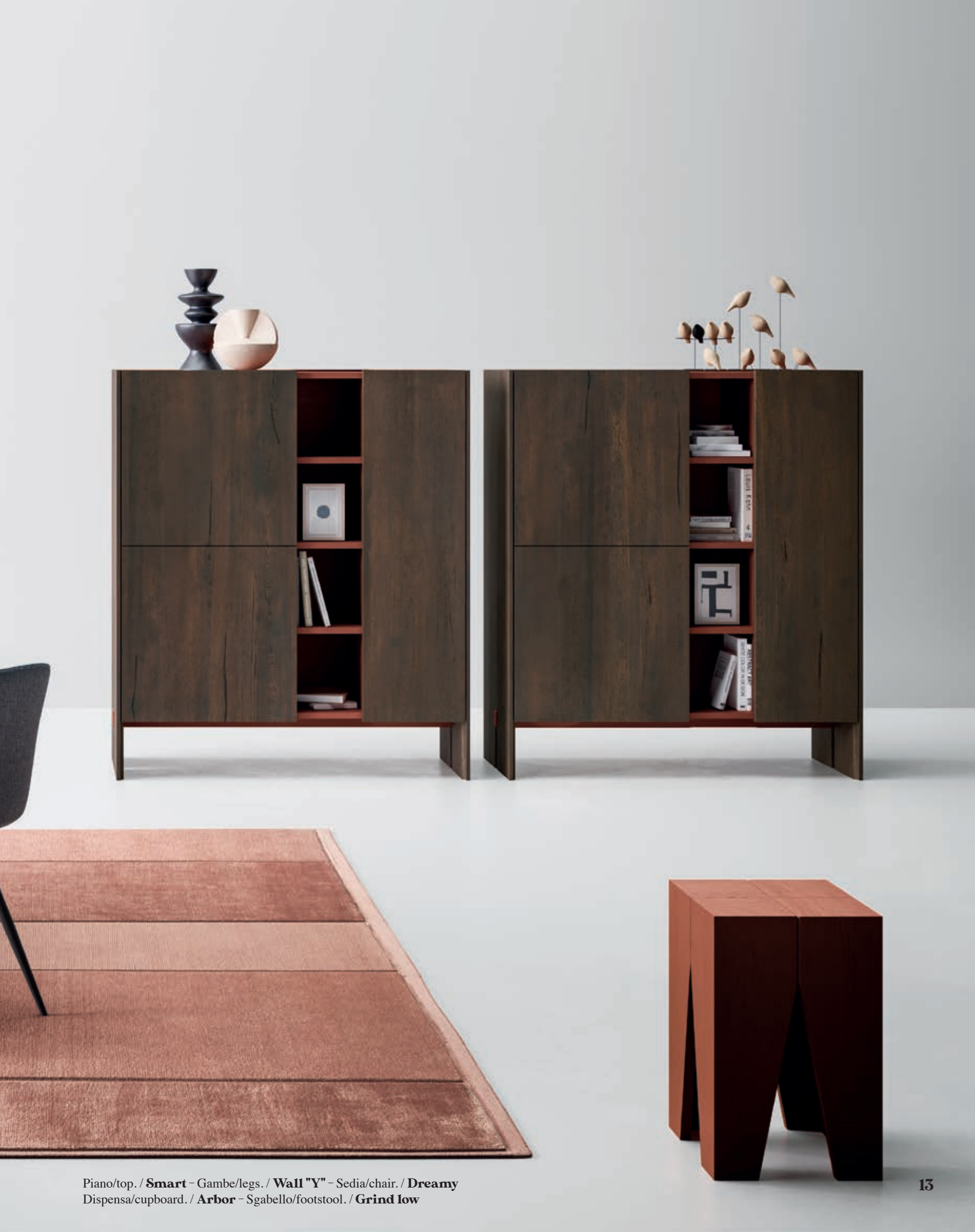
Piano/top. / Smart - Gambe/legs. / Wall "Y" - Sedia/chair. / Dreamy Dispensa/cupboard. / Arbor - Sgabello/footstool. / Grind low