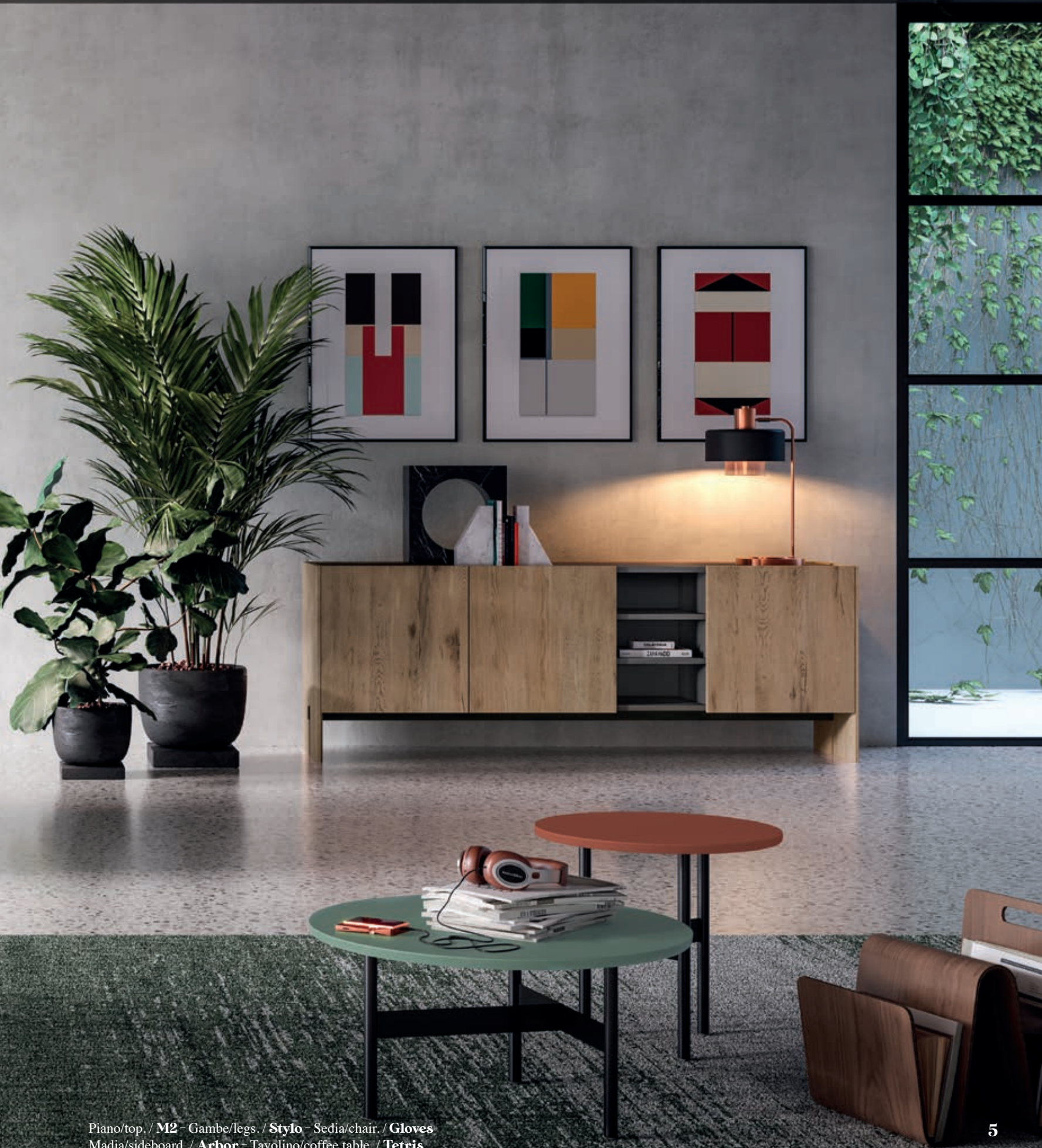
Piano/top. / M2 - Gambe/legs. / Stylo - Sedia/chair. / Gloves Madia/sideboard. / Arbor - Tavolino/coffee table. / Tetris