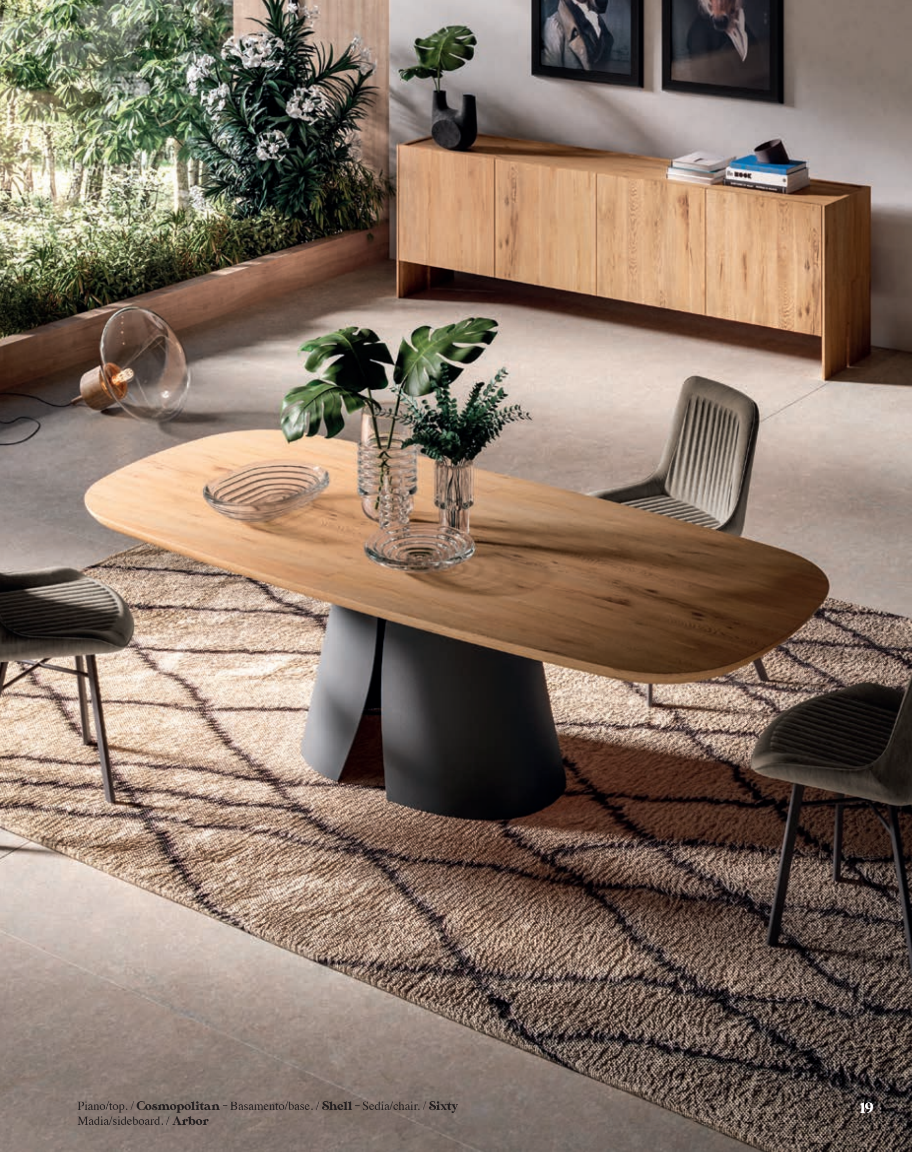
Piano/top. / Cosmopolitan - Basamento/base. / Shell - Sedia/chair. / Sixty Madia/sideboard. / Arbor