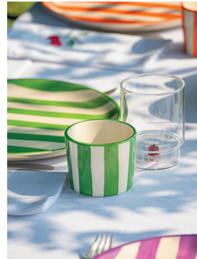
Teca Mare (TE00106 + TE00102), Maestro (MA00620 + MA00520), No Bilia + Lido (NBA0101 + RIM0302)