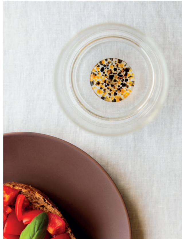
Bilia Candy (BAY0111), Funnel (FNL1218), Teca Terrazzo (TE00122)