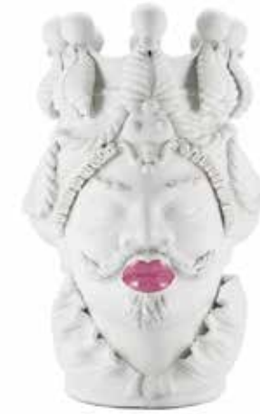
200840,50 VASE MORO MAN BIG LIPSTICK H48