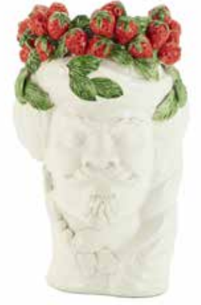
201205,SY NO FACE HEAD VASE MAN H32