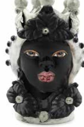
200943,90 VASE MORO LADY EVE H33