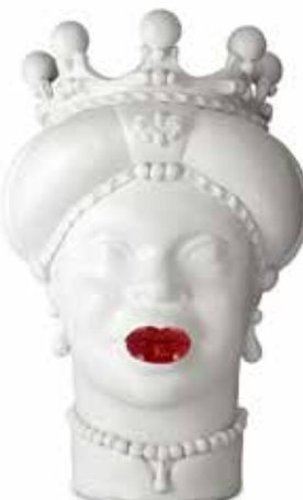
201247,40 VASE MORO LADY MEDIUM LIPSTICK H42