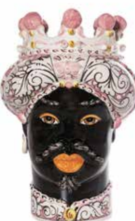
200858,50 VASE MORO MAN ORNATE H41