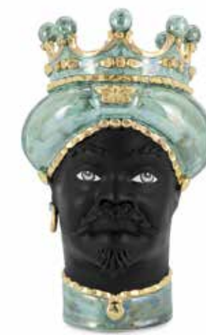
201075,70 VASE MORO MAN MED. MOP H45