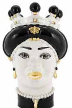
200844,90 VASE MORO LADY MEDIUM NEW H42