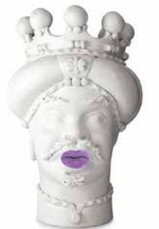
201248,60 VASE MORO MAN MEDIUM LIPSTICK H42