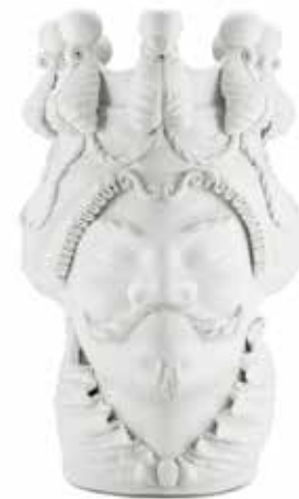
200838,WT VASE MORO MAN BIG W/CANDLEHOLDER H48