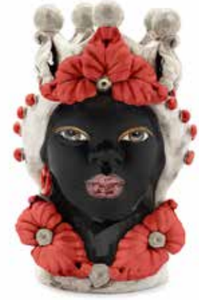
200943,40 VASE MORO LADY EVE H33