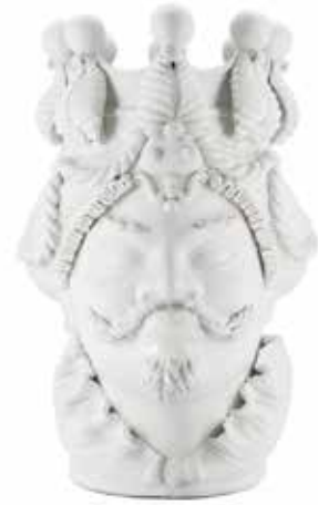
200840,10 VASE MORO MAN BIG LIPSTICK H48