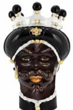
200843,90 VASE MORO MAN MEDIUM NEW H42