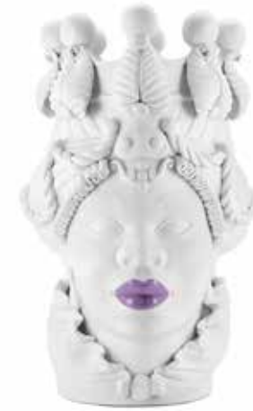
200839,60 VASE MORO LADY BIG LIPSTICK H48