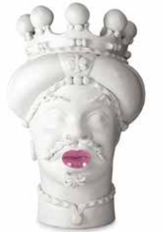
201248,50 VASE MORO MAN MEDIUM LIPSTICK H42