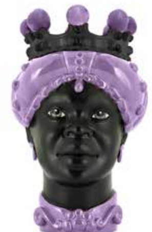
201217,60 VASE MORO LADY CROWN DARK H41