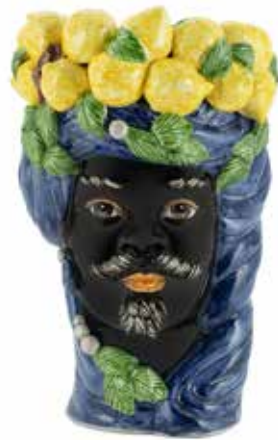
201201,80 VASE LEMON HEAD MAN H32