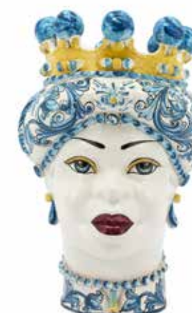
201237,81 VASE MORO LADY ORNATE WHITE FACE H41