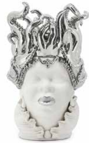
200996,03 VASE MORO LADY TENTACLES H50