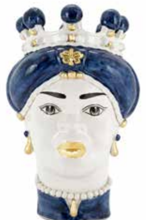
200844,94 VASE MORO LADY MEDIUM NEW H42