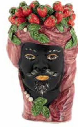
201203,BO VASE STRAWBERRIES HEAD MAN H32