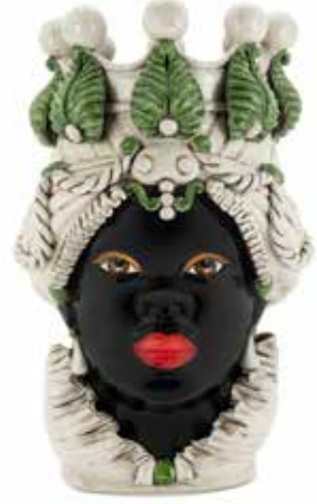
200654,86 VASE MORO LADY BIG H48