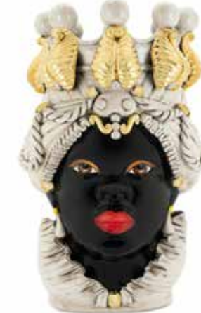
200654,01 VASE MORO LADY BIG H48