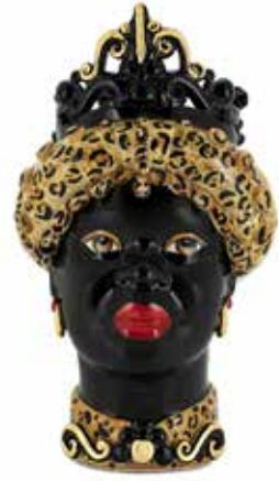
200656,MO VASE MORO LADY MEDIUM H45