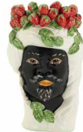
201203,10 VASE STRAWBERRIES HEAD MAN H32