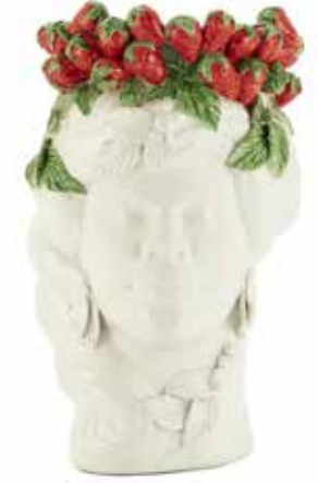
201204,SY NO FACE HEAD VASE LADY H32