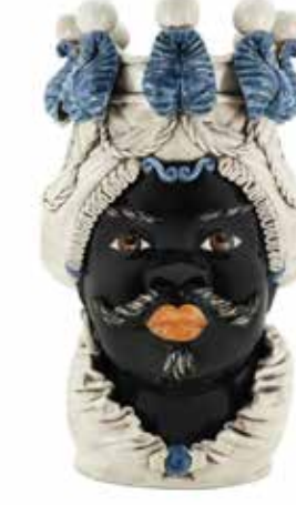
200838,80 VASE MORO MAN BIG W/CANDLEHOLDER H48