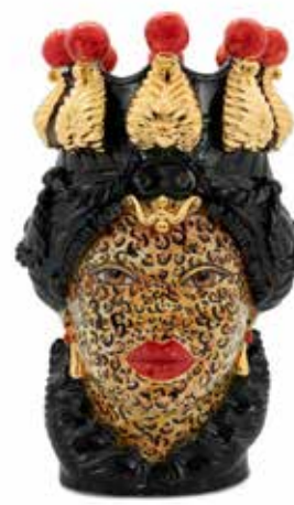
200654,LP VASE MORO LADY BIG H48