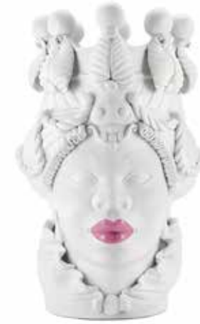
200839,50 VASE MORO LADY BIG LIPSTICK H48