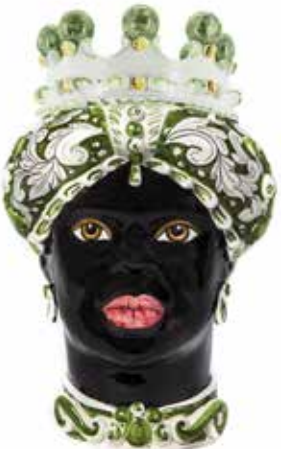
200859,86 VASE MORO LADY ORNATE H41