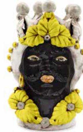
200944,20 VASE MORO MAN EVE H33