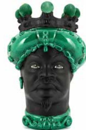
201238,MK VASE MORO MAN CROWN DARK H41