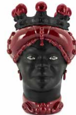
201217,48 VASE MORO LADY CROWN DARK H41