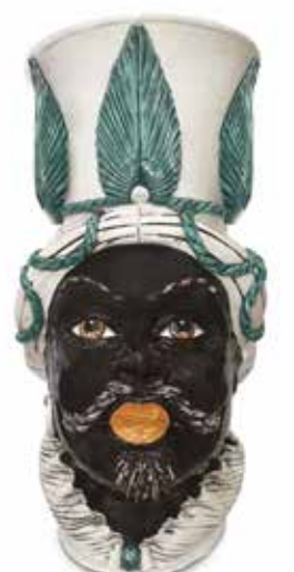
201242,MK VASE MORO MAN GIANT W/LEAF H76