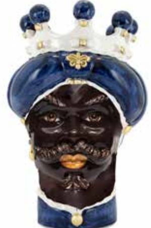
200843,94 VASE MORO MAN MEDIUM NEW H42