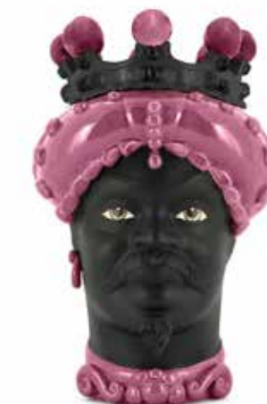
201238,50 VASE MORO MAN CROWN DARK H41