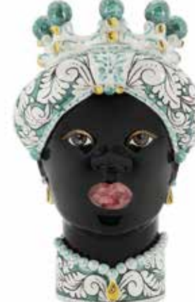
200859,70 VASE MORO LADY ORNATE H41