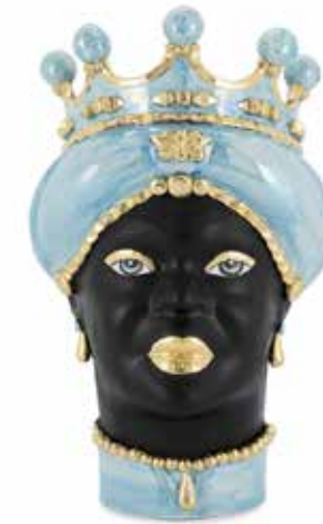
201074,85 VASE MORO LADY MED. MOP H45