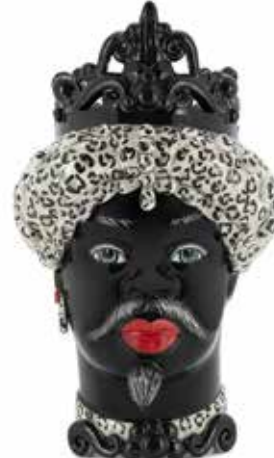
200657,BW VASE MORO MAN MEDIUM H45