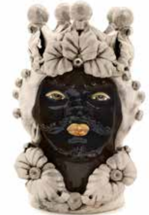
200944,77 VASE MORO MAN EVE H33