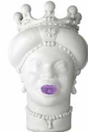
201247,60 VASE MORO LADY MEDIUM LIPSTICK H42