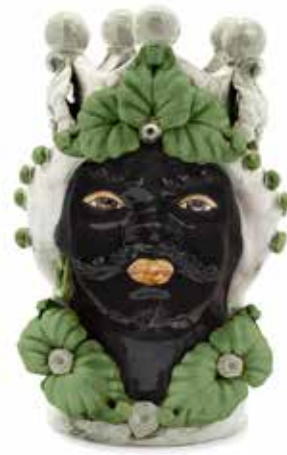
200944,86 VASE MORO MAN EVE H33