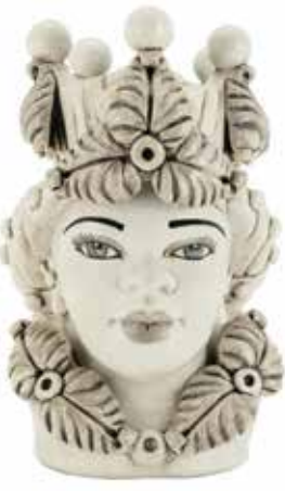
200943,NE VASE MORO LADY EVE H33