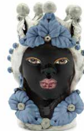
200943,80 VASE MORO LADY EVE H33