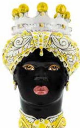
200859,20 VASE MORO LADY ORNATE H41