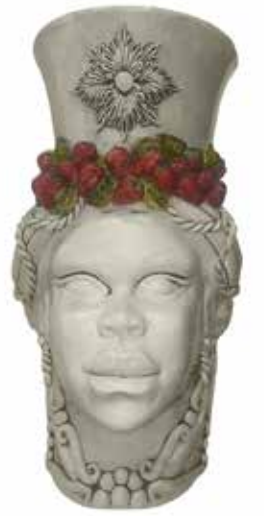
201240,SY VASE HEAD LADY GIANT CRACKLE' H76