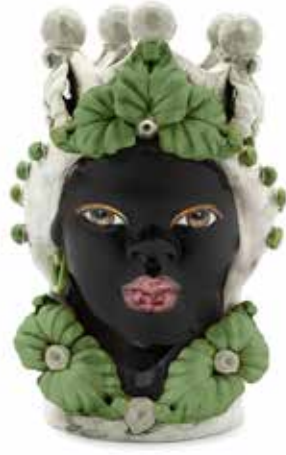
200943,86 VASE MORO LADY EVE H33