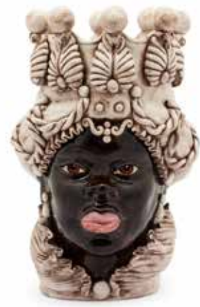
200654,77 VASE MORO LADY BIG H48