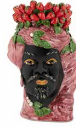
201214,BO VASE STRAWBERRIES HEAD MAN BIG H45