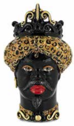
200657,MO VASE MORO MAN MEDIUM H45