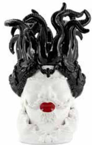
200997,90 VASE MORO MAN TENTACLES H50