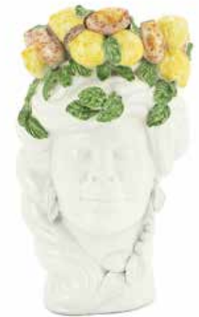
201204,MV NO FACE HEAD VASE LADY H32