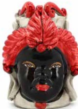
200941,40 VASE MORO LADY SMALL H19