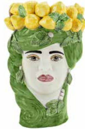
201200,70 VASE LEMON HEAD LADY H32