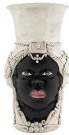
200846,10 VASE MORO LADY GIANT H76