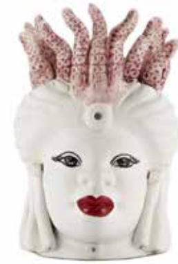
200998,50 VASE MORO LADY SMALL TENTACLES H22