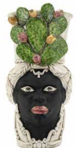
200954,86 VASE MORO LADY FICO GIANT H86