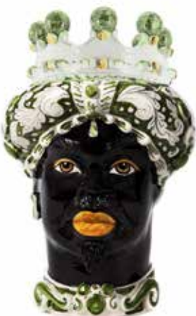
200858,86 VASE MORO MAN ORNATE H41