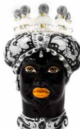
200858,90 VASE MORO MAN ORNATE H41