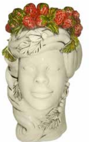
201204,CS NO FACE HEAD VASE LADY H32