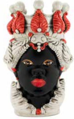
200654,40 VASE MORO LADY BIG H48