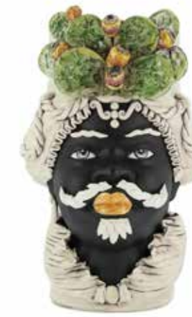
200995,86 VASE MORO MAN FICO BIG H48