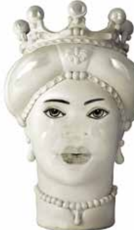
200844,NE VASE MORO LADY MEDIUM NEW H42