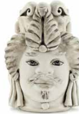
200942,NE VASE MORO MAN SMALL H19