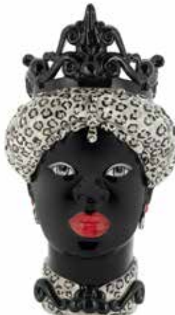
200656,BW VASE MORO LADY MEDIUM H45