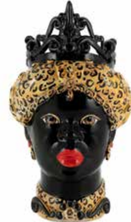
200656,MI VASE MORO LADY MEDIUM H45