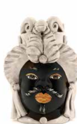
200942,77 VASE MORO MAN SMALL H19