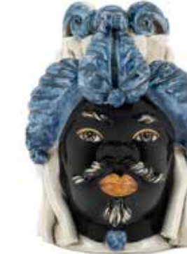
200942,80 VASE MORO MAN SMALL H19