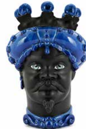
201238,80 VASE MORO MAN CROWN DARK H41