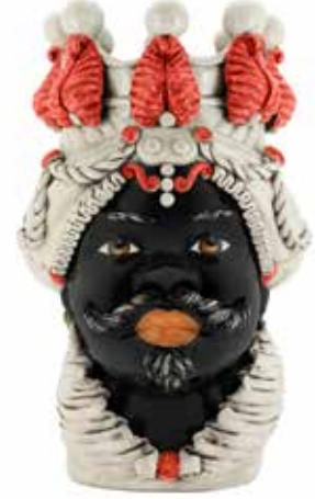
200655,40 VASE MORO MAN BIG H48