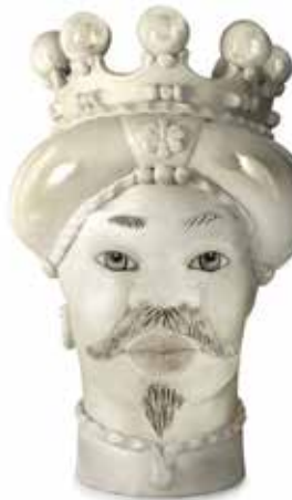
200843,NE VASE MORO MAN MEDIUM NEW H42