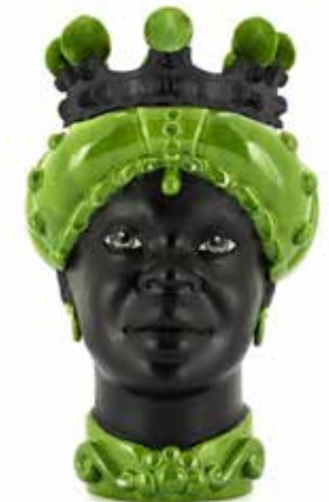
201217,70 VASE MORO LADY CROWN DARK H41