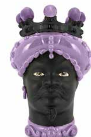
201238,60 VASE MORO MAN CROWN DARK H41