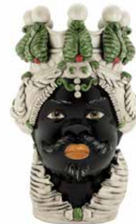
200877,74 VASE MORO MAN LTD H50