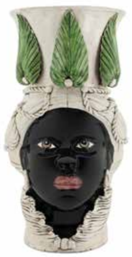
200845,86 VASE MORO LADY GIANT W/LEAF H76