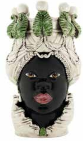
200837,86 VASE MORO LADY BIG W/CANDLEHOLDER H48