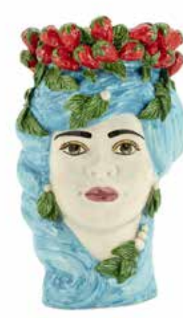
201202,82 VASE STRAWBERRIES HEAD LADY H32