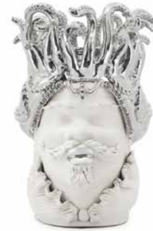
200997,03 VASE MORO MAN TENTACLES H50