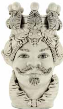
200655,NE VASE MORO MAN BIG H48