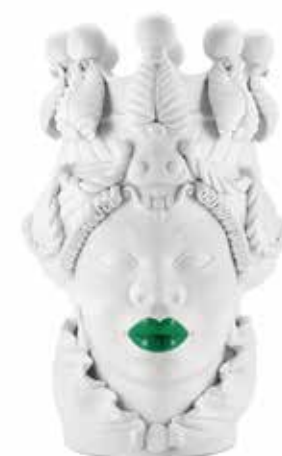
200839,MK VASE MORO LADY BIG LIPSTICK H48