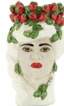
201202,10 VASE STRAWBERRIES HEAD LADY H32