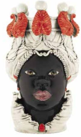
200837,40 VASE MORO LADY BIG W/CANDLEHOLDER H48