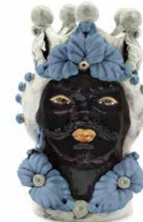
200944,80 VASE MORO MAN EVE H33