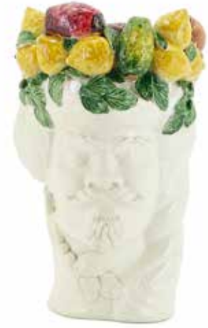
201205,MN NO FACE HEAD VASE MAN H32