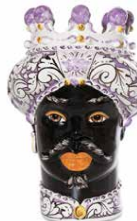
200858,60 VASE MORO MAN ORNATE H41