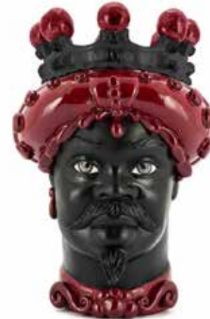
201238,48 VASE MORO MAN CROWN DARK H41