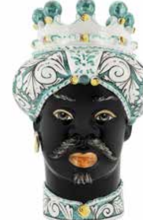
200858,70 VASE MORO MAN ORNATE H41