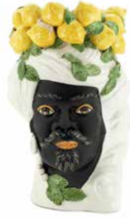
201212,10 VASE LEMON HEAD MAN BIG H45