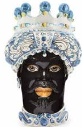
200858,80 VASE MORO MAN ORNATE H41