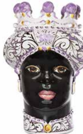
200859,60 VASE MORO LADY ORNATE H41