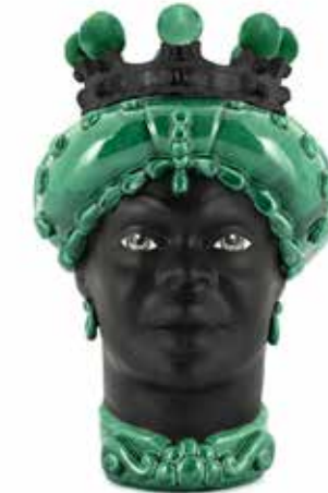
201217,MK VASE MORO LADY CROWN DARK H41