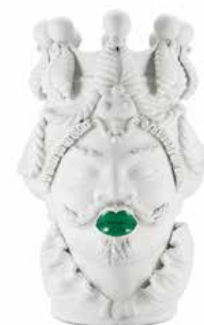
200840,MK VASE MORO MAN BIG LIPSTICK H48