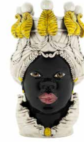
200837,20 VASE MORO LADY BIG W/CANDLEHOLDER H48