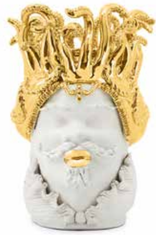
200997,01 VASE MORO MAN TENTACLES H50