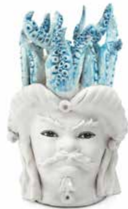
200999,82 VASE MORO MAN SMALL TENTACLES H22