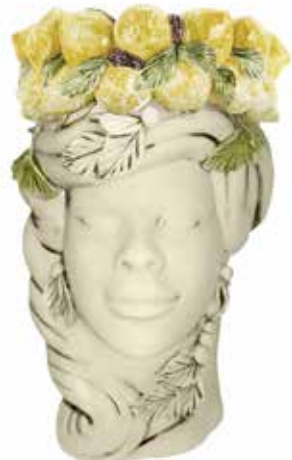
201204,CL NO FACE HEAD VASE LADY H32