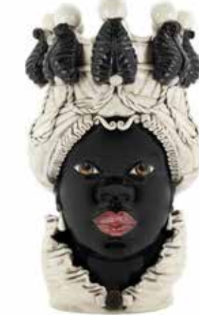
200837,90 VASE MORO LADY BIG W/CANDLEHOLDER H48