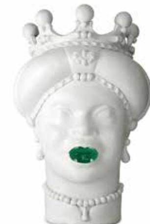
201247,MK VASE MORO LADY MEDIUM LIPSTICK H42