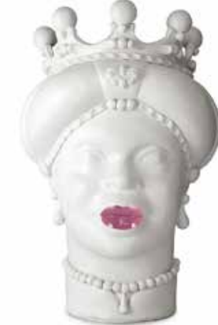
201247,50 VASE MORO LADY MEDIUM LIPSTICK H42