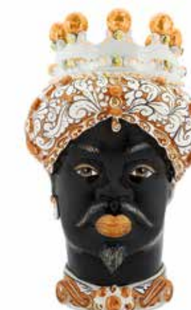
200858,30 VASE MORO MAN ORNATE H41