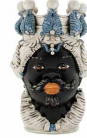
200655,80 VASE MORO MAN BIG H48