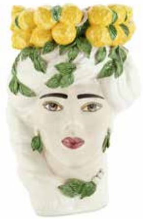
201211,10 VASE LEMON HEAD LADY BIG H45