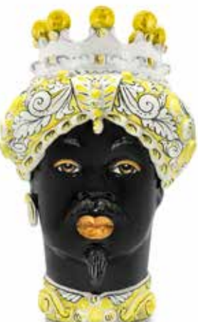
200858,20 VASE MORO MAN ORNATE H41