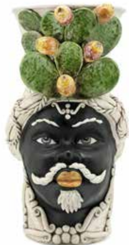
200955,86 VASE MORO MAN FICO GIANT H86