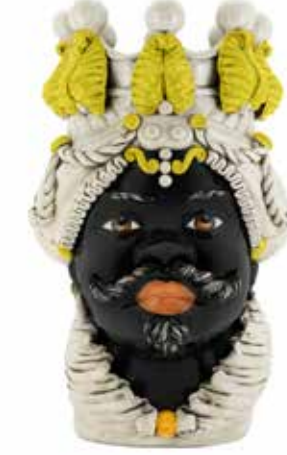
200655,20 VASE MORO MAN BIG H48