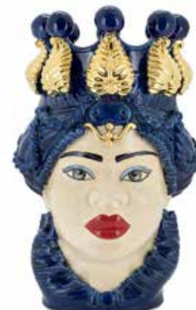
200876,80 VASE MORO LADY LTD H50