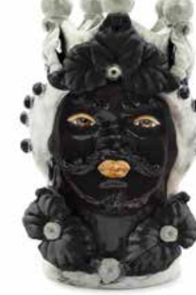
200944,90 VASE MORO MAN EVE H33