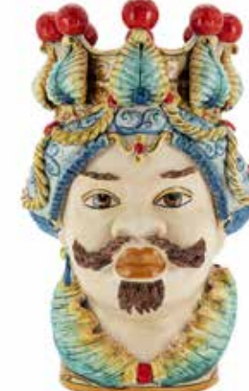
201079,10 VASE MORO MAN BIG TRAD. H48