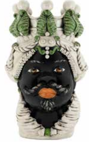
200655,86 VASE MORO MAN BIG H48