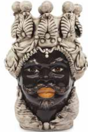
200655,77 VASE MORO MAN BIG H48