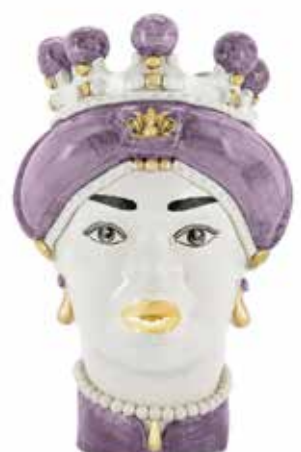
200844,60 VASE MORO LADY MEDIUM NEW H42