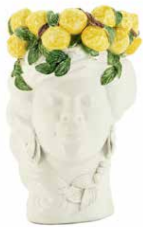
201204,LE NO FACE HEAD VASE LADY H32