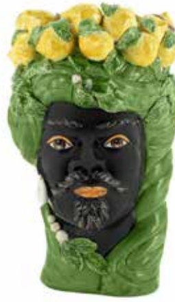
201212,70 VASE LEMON HEAD MAN BIG H45