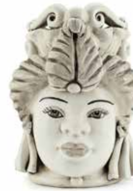
200941,NE VASE MORO LADY SMALL H19