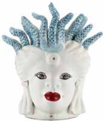
201000,82 VASE MORO LADY SMALL MEDUSA H22