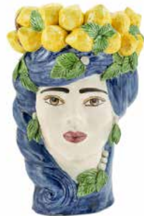
201211,80 VASE LEMON HEAD LADY BIG H45