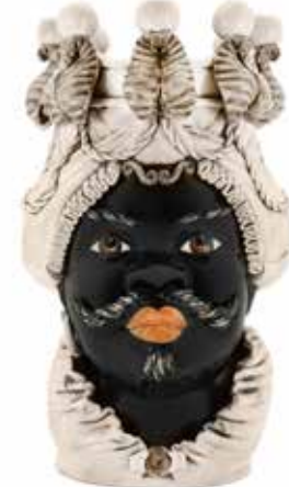
200838,77 VASE MORO MAN BIG W/CANDLEHOLDER H48