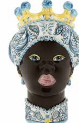
200859,81 VASE MORO LADY ORNATE H41