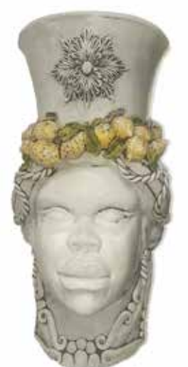
201240,LE VASE HEAD LADY GIANT CRACKLE' H76