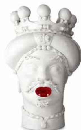
201248,40 VASE MORO MAN MEDIUM LIPSTICK H42