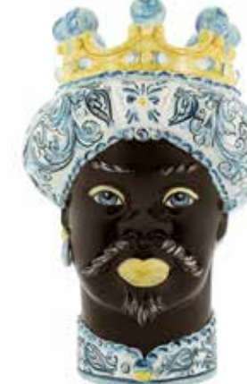
200858,81 VASE MORO MAN ORNATE H41