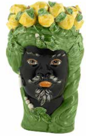
201201,70 VASE LEMON HEAD MAN H32