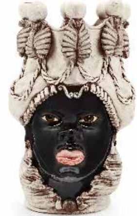
200837,77 VASE MORO LADY BIG W/CANDLEHOLDER H48