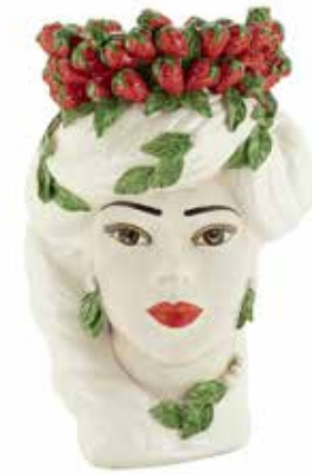
201213,10 VASE STRAWBERRIES HEAD LADY BIG H45