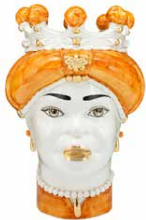
200844,25 VASE MORO LADY MEDIUM NEW H42