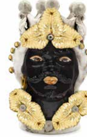
200944,01 VASE MORO MAN EVE H33