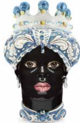
200859,80 VASE MORO LADY ORNATE H41