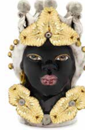
200943,01 VASE MORO LADY EVE H33