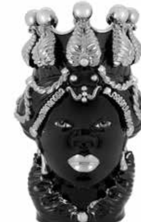
200876,03 VASE MORO LADY LTD H50