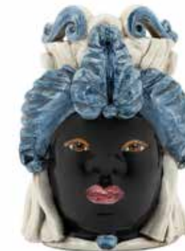
200941,80 VASE MORO LADY SMALL H19