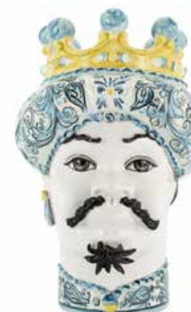
201251,81 VASE MORO MAN ORNATE WHITE FACE H41