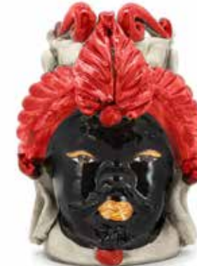
200942,40 VASE MORO MAN SMALL H19