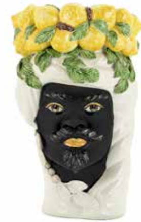
201201,10 VASE LEMON HEAD MAN H32