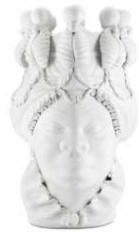
200837,WT VASE MORO LADY BIG W/CANDLEHOLDER H48