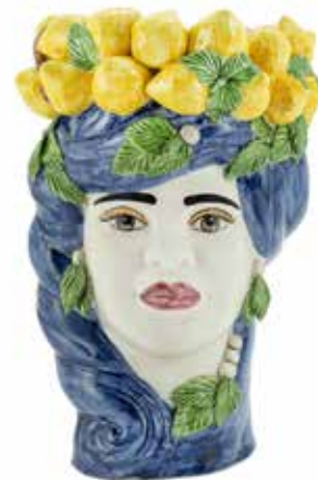
201200,80 VASE LEMON HEAD LADY H32