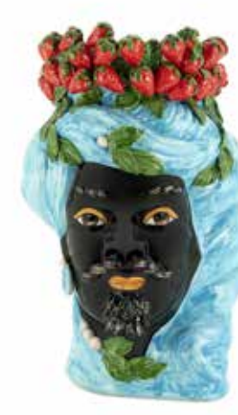
201214,82 VASE STRAWBERRIES HEAD MAN BIG H45