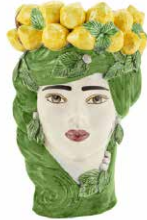
201211,70 VASE LEMON HEAD LADY BIG H45