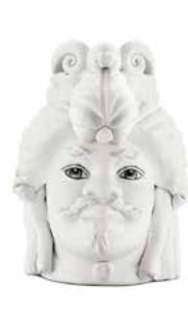
200942,WT VASE MORO MAN SMALL H19