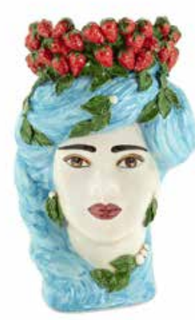
201213,82 VASE STRAWBERRIES HEAD LADY BIG H45