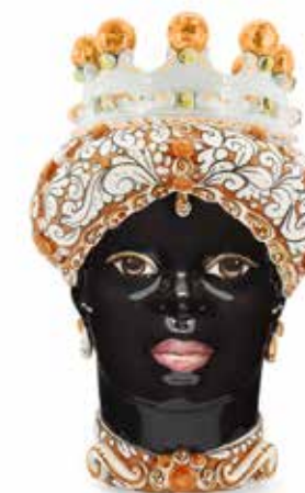
200859,30 VASE MORO LADY ORNATE H41