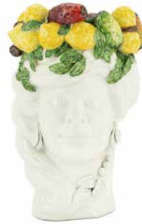
201204,MN NO FACE HEAD VASE LADY H32