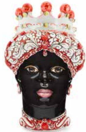
200859,40 VASE MORO LADY ORNATE H41