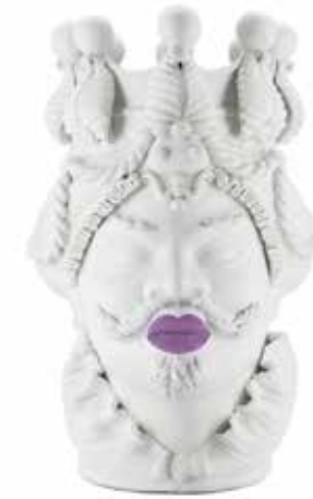
200840,60 VASE MORO MAN BIG LIPSTICK H48