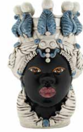
200654,80 VASE MORO LADY BIG H48