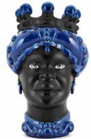
201217,80 VASE MORO LADY CROWN DARK H41