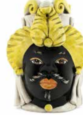
200942,20 VASE MORO MAN SMALL H19