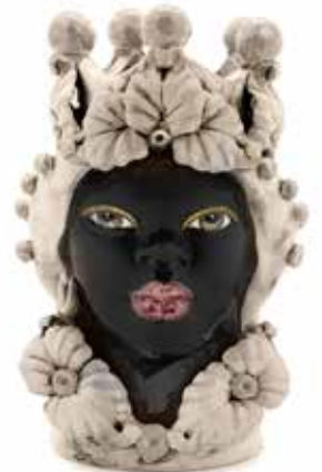
200943,77 VASE MORO LADY EVE H33