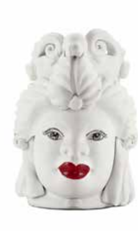
200941,WT VASE MORO LADY SMALL H19