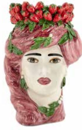
201213,BO VASE STRAWBERRIES HEAD LADY BIG H45