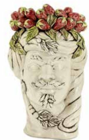
201205,CS NO FACE HEAD VASE MAN H32