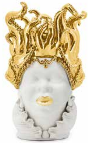
200996,01 VASE MORO LADY TENTACLES H50