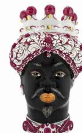
200858,80 VASE MORO MAN ORNATE H41