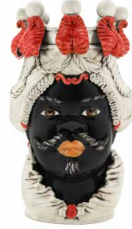
200838,40 VASE MORO MAN BIG W/CANDLEHOLDER H48