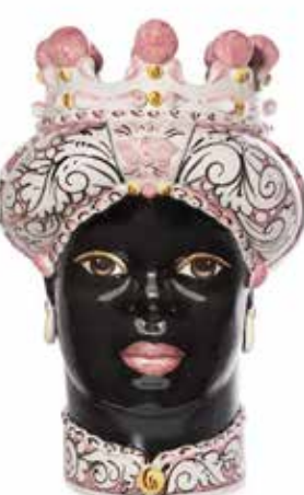
200859,50 VASE MORO LADY ORNATE H41