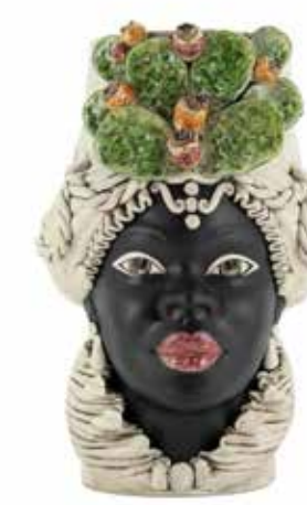
200994,86 VASE MORO LADY FICO BIG H48