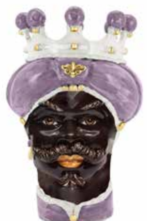
200843,60 VASE MORO MAN MEDIUM NEW H42