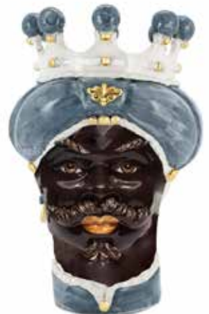
200843,GG VASE MORO MAN MEDIUM NEW H42