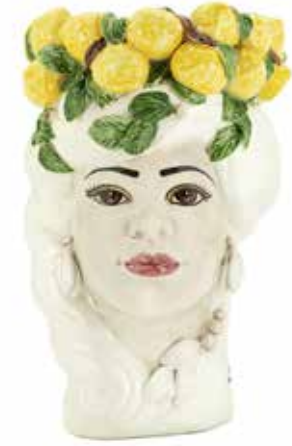
201200,10 VASE LEMON HEAD LADY H32