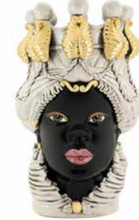
200837,01 VASE MORO LADY BIG W/CANDLEHOLDER H48