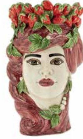
201202,BO VASE STRAWBERRIES HEAD LADY H32