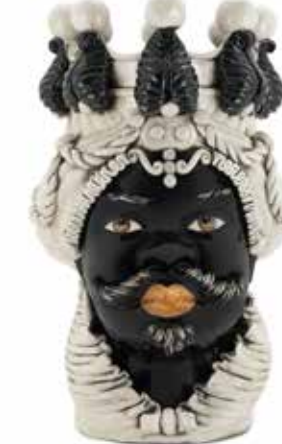
200655,90 VASE MORO MAN BIG H48