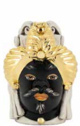
200865,SB VASE MORO MAN SMALL CHIC H19