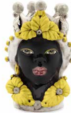
200943,20 VASE MORO LADY EVE H33