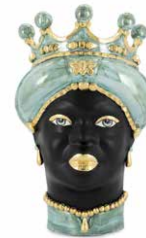
201074,70 VASE MORO LADY MED. MOP H45