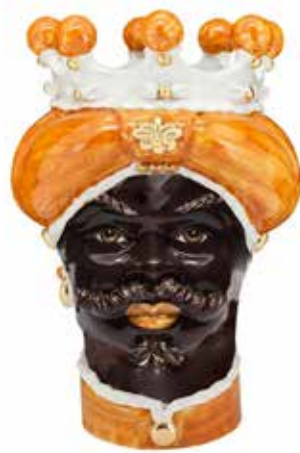
200843,25 VASE MORO MAN MEDIUM NEW H42