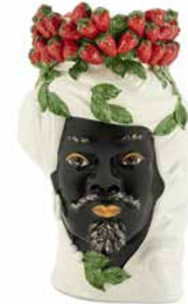
201214,10 VASE STRAWBERRIES HEAD MAN BIG H45