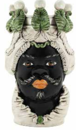
200838,86 VASE MORO MAN BIG W/CANDLEHOLDER H48