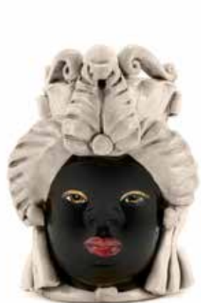
200941,77 VASE MORO LADY SMALL H19