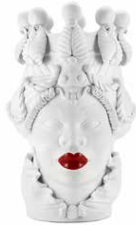
200839,40 VASE MORO LADY BIG LIPSTICK H48