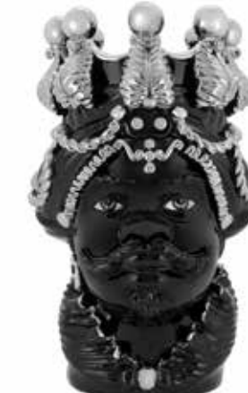
200877,03 VASE MORO MAN LTD H50