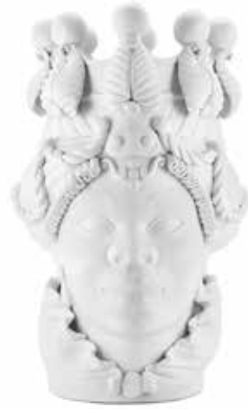
200839,10 VASE MORO LADY BIG LIPSTICK H48