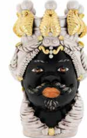
200655,01 VASE MORO MAN BIG H48