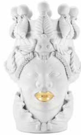
200839,01 VASE MORO LADY BIG LIPSTICK H48