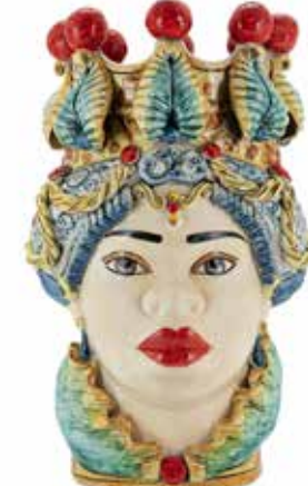
201078,10 VASE MORO LADY BIG TRAD. H48