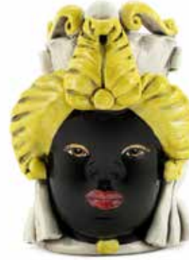
200941,20 VASE MORO LADY SMALL H19