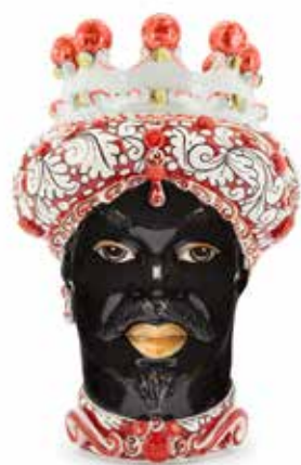
200858,40 VASE MORO MAN ORNATE H41