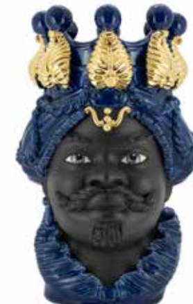
200877,80 VASE MORO MAN LTD H50