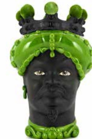
201238,70 VASE MORO MAN CROWN DARK H41