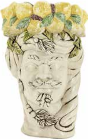
201205,CL NO FACE HEAD VASE MAN H32