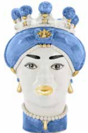
200844,80 VASE MORO LADY MEDIUM NEW H42