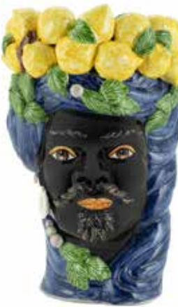
201212,80 VASE LEMON HEAD MAN BIG H45