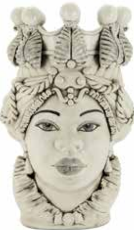
200654,NE VASE MORO LADY BIG H48