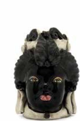
200941,90 VASE MORO LADY SMALL H19