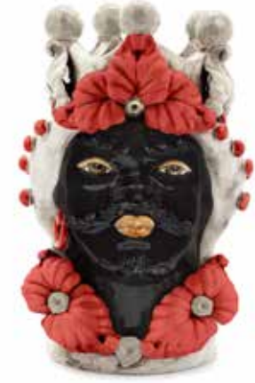
200944,40 VASE MORO MAN EVE H33