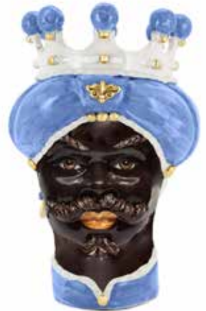
200843,80 VASE MORO MAN MEDIUM NEW H42