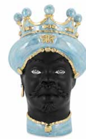
201075,85 VASE MORO MAN MED. MOP H45