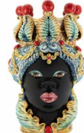
201078,MI VASE MORO LADY BIG TRAD. H48