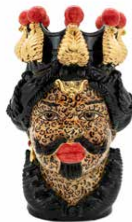
200655,LP VASE MORO MAN BIG H48