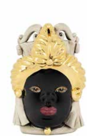
200866,SB VASE MORO LADY SMALL CHIC H19