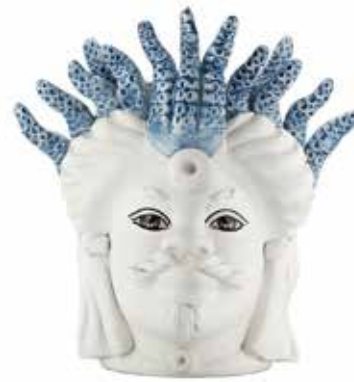
201001,81 VASE MORO MAN SMALL MEDUSA H22