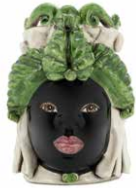
200941,86 VASE MORO LADY SMALL H19