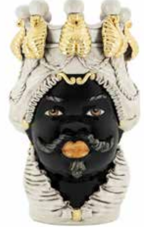
200838,01 VASE MORO MAN BIG W/CANDLEHOLDER H48