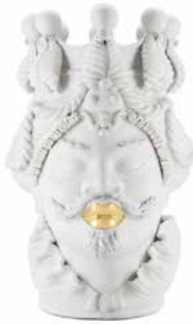
200840,01 VASE MORO MAN BIG LIPSTICK H48