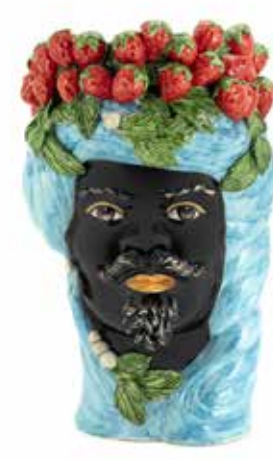
201203,82 VASE STRAWBERRIES HEAD MAN H32