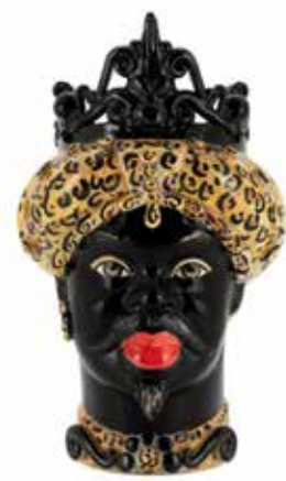
200657,MI VASE MORO MAN MEDIUM H45