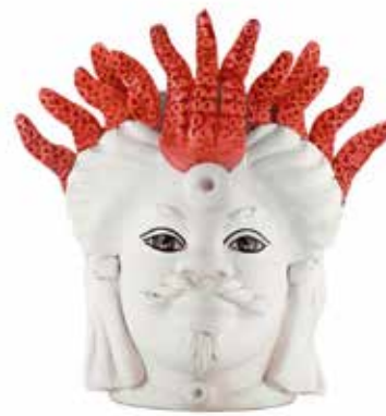
201001,40 VASE MORO MAN SMALL MEDUSA H22