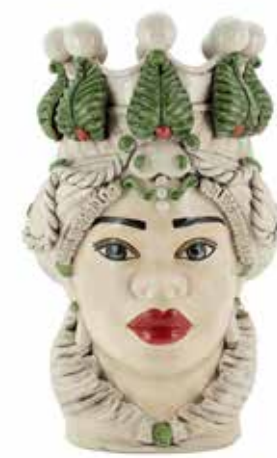
200876,74 VASE MORO LADY LTD H50