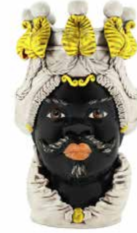
200838,20 VASE MORO MAN BIG W/CANDLEHOLDER H48