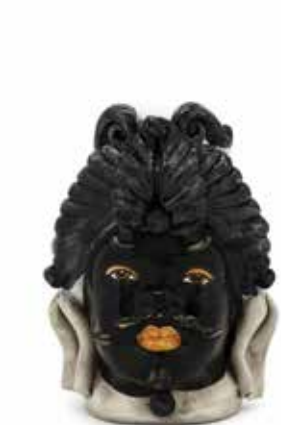
200942,90 VASE MORO MAN SMALL H19