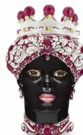
200859,80 VASE MORO LADY ORNATE H41