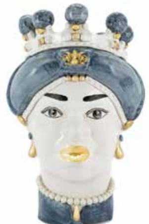
200844,GG VASE MORO LADY MEDIUM NEW H42