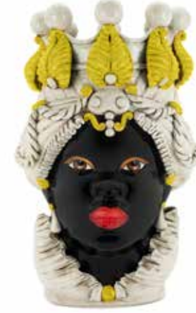
200654,20 VASE MORO LADY BIG H48