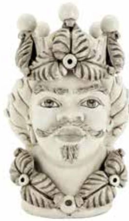
200944,NE VASE MORO MAN EVE H33