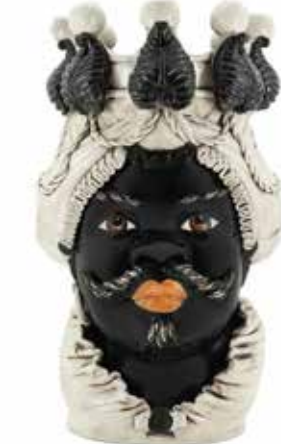
200838,90 VASE MORO MAN BIG W/CANDLEHOLDER H48