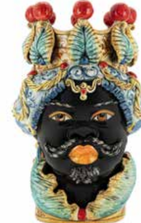
201079,MI VASE MORO MAN BIG TRAD. H48