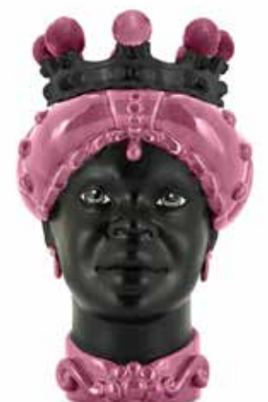
201217,50 VASE MORO LADY CROWN DARK H41