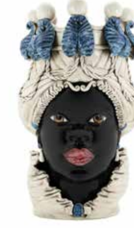
200837,80 VASE MORO LADY BIG W/CANDLEHOLDER H48