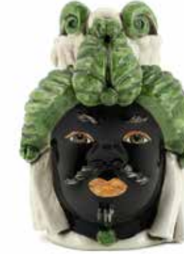
200942,86 VASE MORO MAN SMALL H19