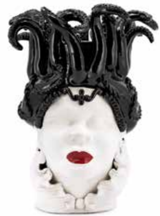
200996,90 VASE MORO LADY TENTACLES H50