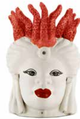
200998,40 VASE MORO LADY SMALL TENTACLES H22