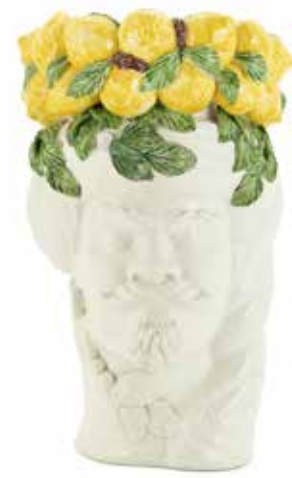
201205,LE NO FACE HEAD VASE MAN H32