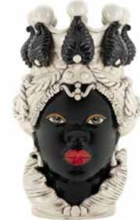
200654,90 VASE MORO LADY BIG H48