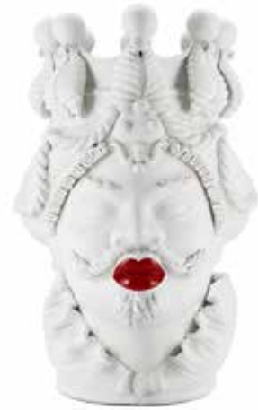
200840,40 VASE MORO MAN BIG LIPSTICK H48