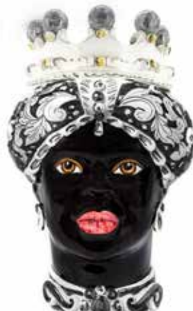
200859,90 VASE MORO LADY ORNATE H41