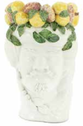
201205,MV NO FACE HEAD VASE MAN H32