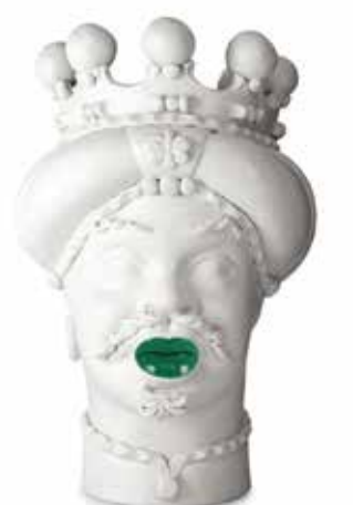
201248,MK VASE MORO MAN MEDIUM LIPSTICK H42