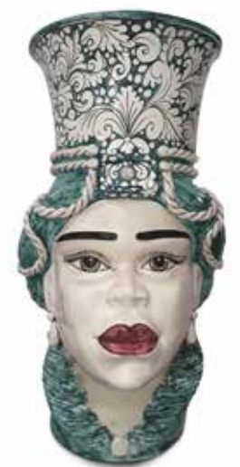
201241,MK VASE MORO LADY GIANT ORNATE H76