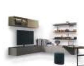
Scrittoi P. 264