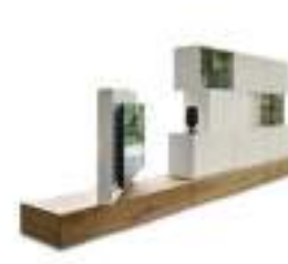
Roto P. 220