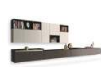
Open P. 102