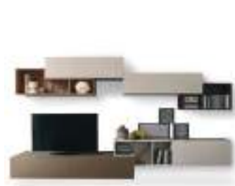
Tetris P. 136