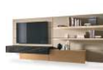
Boiserie TV P. 202