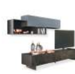
Vesa P. 216