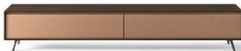
L7C46 - L/W 2430 x H 485 x P/D 546