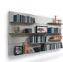
Mensole per Boiserie P. 232