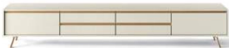
L7C46 - L/W 2430 x H 485 x P/D 546