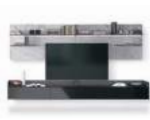
Cabaret One P. 06