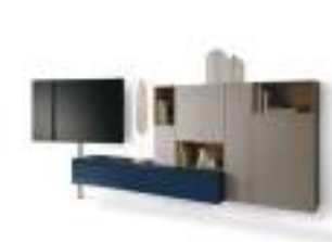
Video P. 212