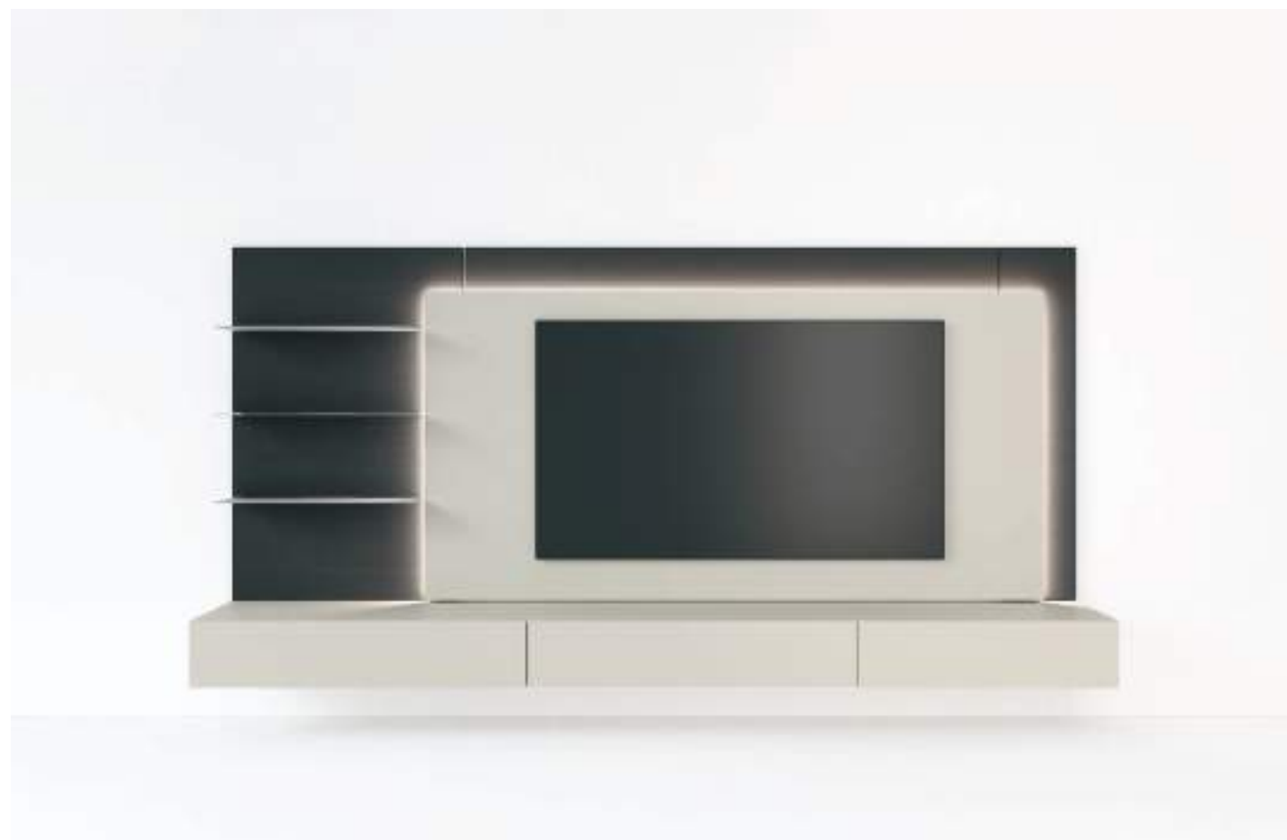
L7C65 - L/W 3000 x H 1680 x P/D 289/546