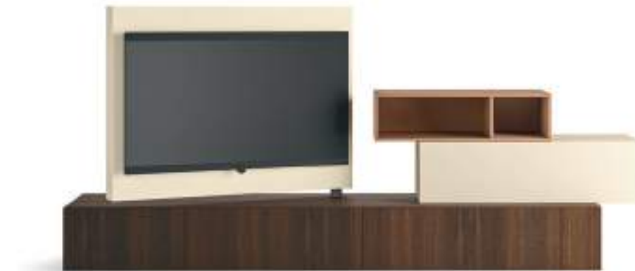
L7C76 - L/W 3000 x H 1435 x P/D 354/546