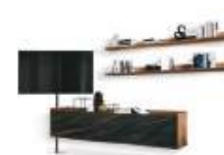
Mensole Super P. 240