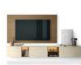
Pannello TV P. 192