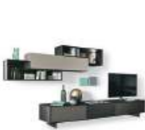
Riquadri P. 146