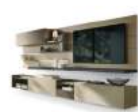
Agio P. 112