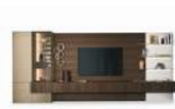
Boiserie P. 66