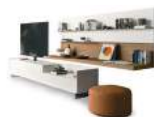
Cabaret Step P. 36