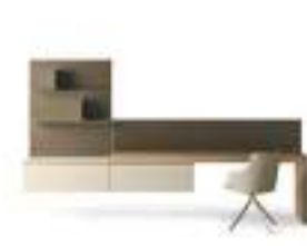
Pianali SP60 P. 250