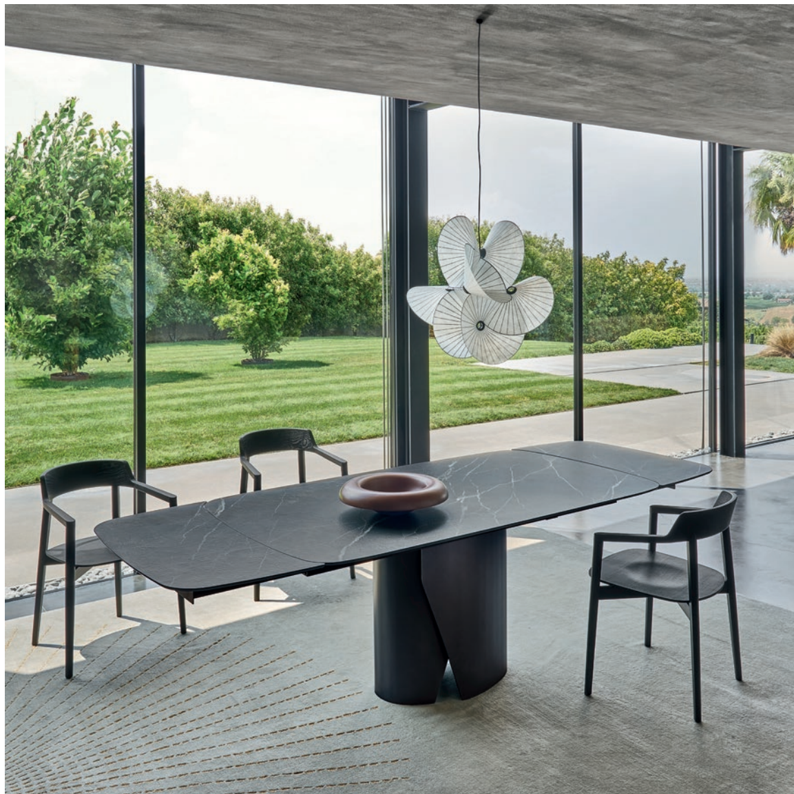
Tavolo / Table Plug L/W 1800+427+427 x H 756 x P/D 1020