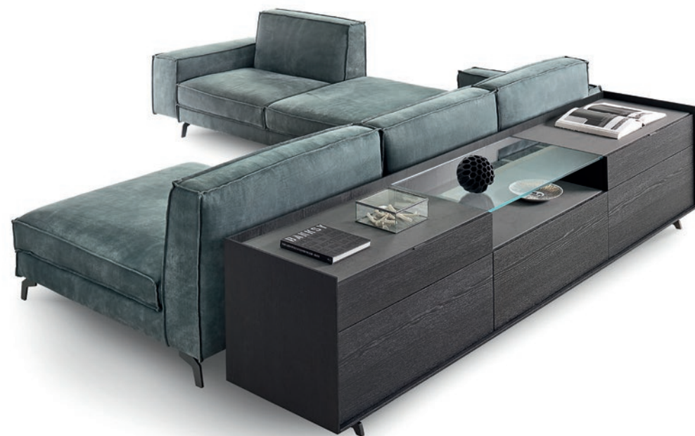
↓ Cabaret Glass L/W 2720 x H 595 x P/D 570