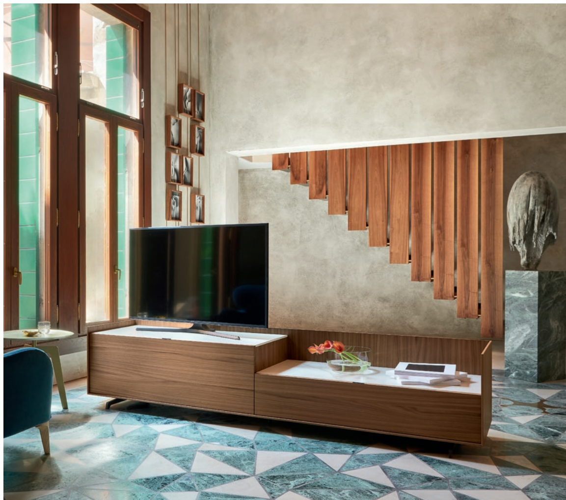
← Cabaret Step L/W 2420 x H 515 x P/D 570