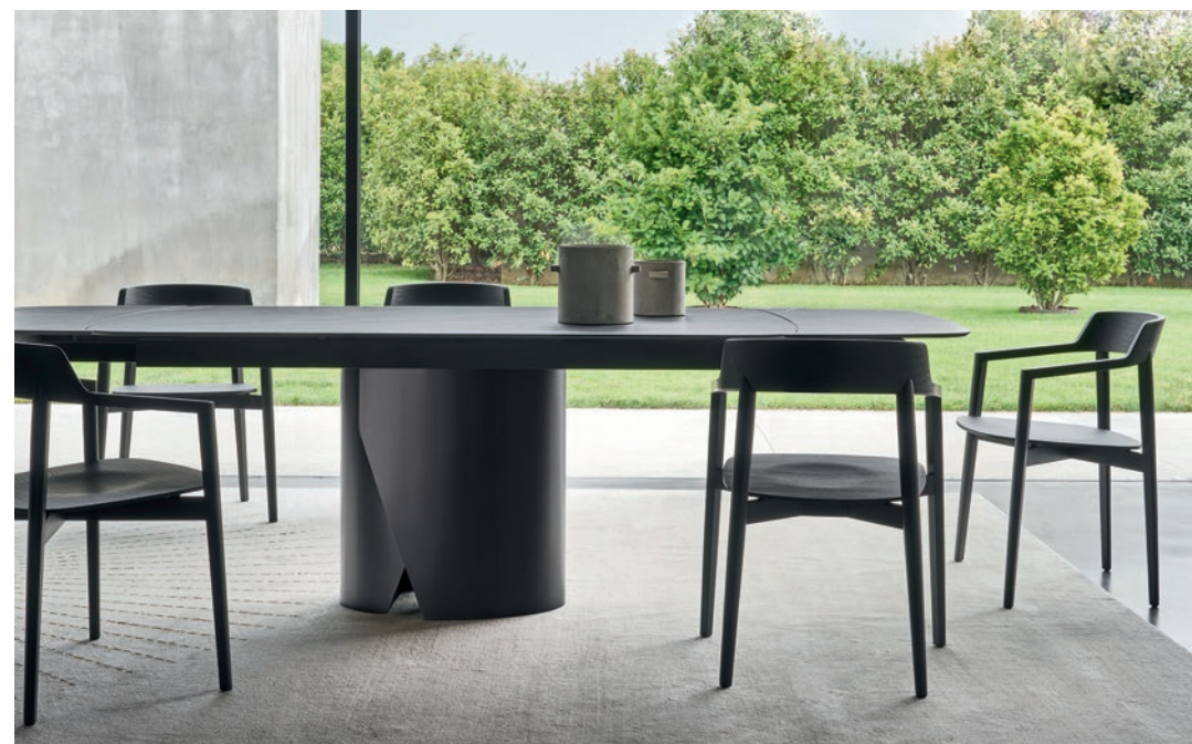
Sedia / Chair Lena L/W 595 x H 430/780 x P/D 487